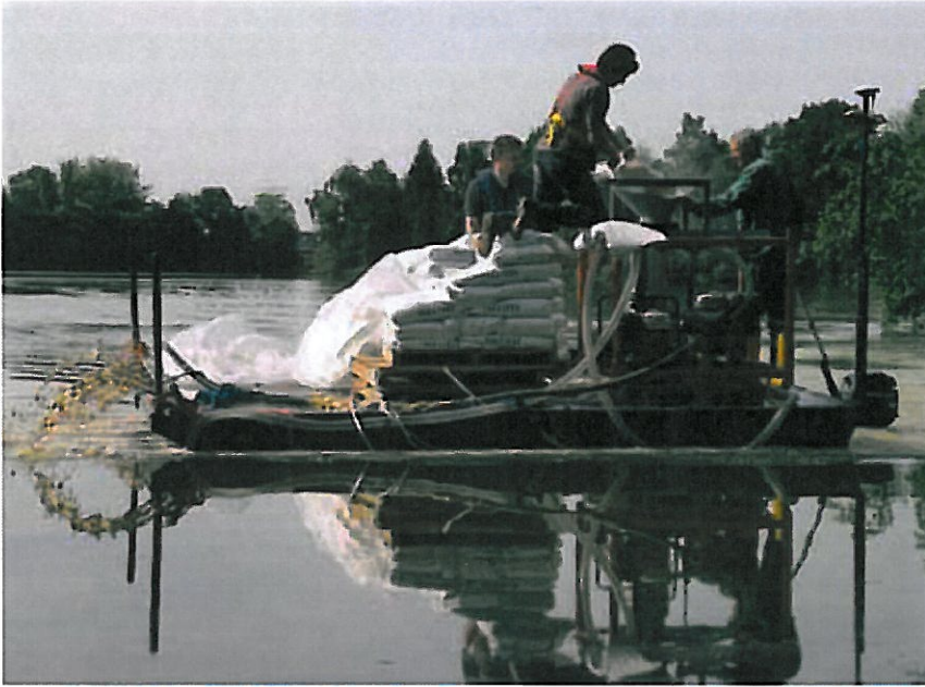
Oppervlakkige toediening van Phoslock in De Kuil, mei 2009.

blijft deze binding behouden bij een van neutraal afwijkende zuurgraad en onder zuurstofloze omstandigheden. Beide omstandigheden doen zich van nature voor bij het sediment van oppervlaktewateren, waardoor defosfateren met aluminium- of ijzorzouten vaak geen afdoende maatregel is. Tot nu toe is in Europa ongeveer tien maal Phoslock toegepast, waarbij na toediening het fosfaatgehalte in de waterfase steeds sterk daalde. Deze daling blijft meerdere jaren behouden 11) .