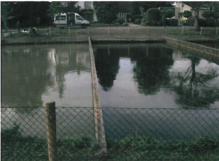
Proeflocatie in Dongen direct na uitvoering van de maatregelen, in september 2009. Het rechtercompartment is gebaggerd en daarna behandeld met polyaluminiumchloride, het linkercompartment is niet gebaggerd en uitsluitend behandeld met Phoslock.

ontstane vlokken waardoor betere bezinking ontstaat. Anderzijds zorgt het fosfaatfixatief voor permanente vastlegging van het uit de waterkolom neergeslagen en van het uit het sediment vrijkomende fosfaat (‘Lock’).