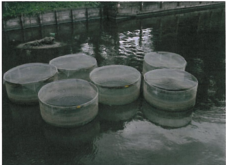
Proeflocatie Heesch met enclosures, september 2009.

Het project ontving subsidie van het Innovatieprogramma Kaderrichtlijn Water van het ministerie van Verkeer en Waterstaat en de Provincie Noord-Brabant.