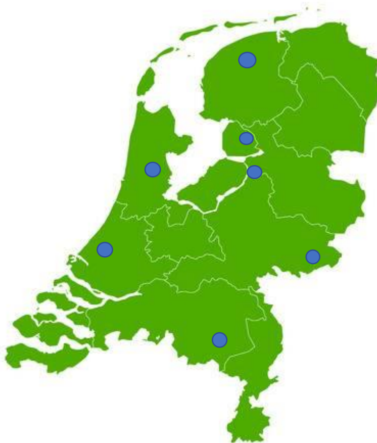
Figuur 1; locaties van de zorgboerderijen in Nederland

Er zijn in totaal vijf interviews afgenomen op zorgboerderijen waar ook onderwijs wordt gegeven. Het onderwijs wordt geboden aan verschillende doelgroepen met verschillende leeftijden. Op één zorgboerderij wordt nog geen onderwijs gegeven. Er is één interview afgenomen met 'koepel', een overkoepelende organisatie voor landbouw, zorg en welzijn in Noord-Holland. 'Koepel' steunt mensen met een beperking en zorgt ervoor dat de cliënten een prettige plek vinden bij zorgboeren. De zes andere zorgboerderijen zijn niet verbonden aan een overkoepelende organisatie. Bij de selectie van de zorgboerderijen is er niet gekeken naar het type onderwijs die op de boerderijen wordt aangeboden. De interviews zijn allemaal afgenomen op de locatie van de zorgboerderij. In figuur 1 hieronder is zichtbaar op welke locaties in Nederland de interviews zijn afgenomen. De geïnterviewde zorgboeren/-boerinnen waren direct enthousiast over de mogelijkheid wat betreft het afnemen van een interview. Er was geen reactie van de overige benaderde zorgboeren/-boerinnen.