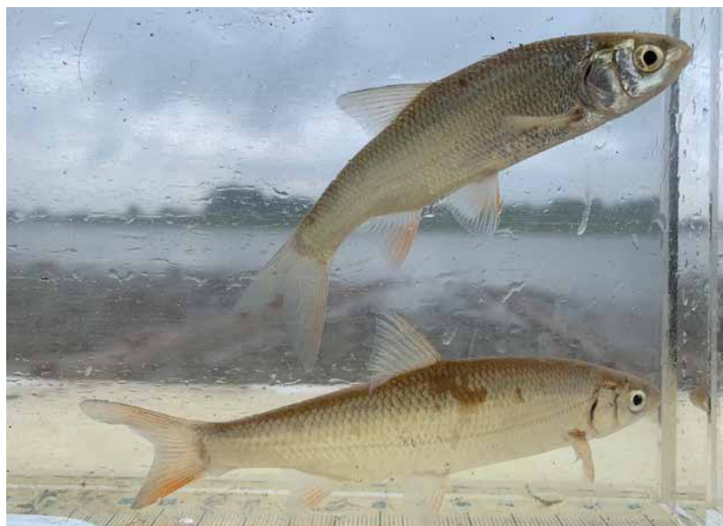
Winde (boven) en sneep zijn veel aangetroffen reofiele soorten binnen het onderzoek.

Dergelijke ondiepe en (half-)aangetakte uiterwaardwateren zullen van nature geleidelijk dichtslibben en dichtgroeien met vegetatie. In natuurlijke riviersystemen ontstaan door erosie of bochtafsnijdingen telkens weer nieuwe geulen en strangen, waardoor dergelijke kraamkamers constant wel