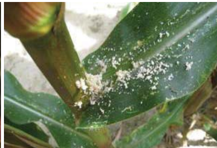
Schaafsel uit korrels