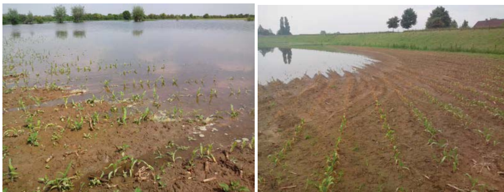
Ondergelopen maispercelen op de uiterwaarden

In voorjaar 2013 hebben maispercelen op de uiterwaarden van onder anderen de Rijn en de IJssel enkele dagen onder water gestaan. Dientengevolge zijn er planten “verdronken” en uiteindelijk dus afgestorven. Als mais langer dan twee dagen onder water staat is de kans op overleving heel klein. Soms zijn hele percelen verdwenen of heeft de mais op hogere delen van het perceel het nog net overleefd. Te overwegen is de mais over of bij te zaaien, maar na 15 juni heeft dit geen zin meer omdat het groeiseizoen dan te kort is. Inzaai van gras is dan wellicht de beste optie.