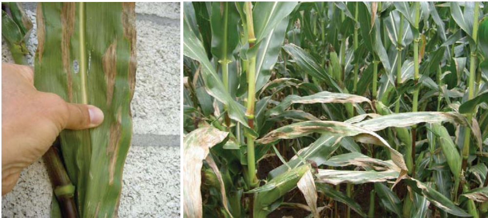
Aantasting door Helminthosporium turcicum

In de praktijk betekent dit dat voor het in pluim komen van de maïs (rond het verschijnen van het vlagblad) beoordeeld moet worden of een preventieve bespuiting noodzakelijk is. Heeft men een minder tolerant ras gezaaid en zijn er reeds enkele vlekken te zien of heeft men de laatste jaren een zware aantasting op het perceel gezien, dan is een preventieve bespuiting aan te raden.