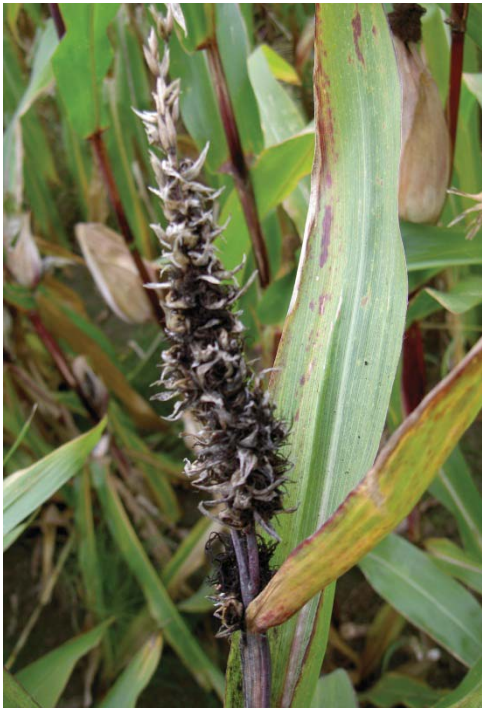
Pluim met zwart schimmelpuis

Via de vaatbundels worden de bloeiwijzen, pluim en kolf, van binnen uit aangetast. Tot de bloei is aan de plant nauwelijks iets te zien, alleen de ontwikkeling blijft wat achter. Op moment van bloei ontstaat er in de pluim zwart schimmelpuis (zie foto) en verminderde stuifmeelproductie. In het schutblad op de plaats van de kolf ontstaat een grote harige schimmelbol, soms met groene uitlopers (foto2), die de gehele kolf vervangen heeft. Bij een aantasting boven de 10% kan het zetmeelgehalte en daarmee de voederwaarde erg tegenvallen doordat de kolf afwezig is. Ook de drogestofopbrengst is lager omdat deze gemiddeld voor 50% uit de kolf bestaat. Bij aantasting van 50% van de planten is het zetmeelgehalte gehalveerd en de opbrengst mogelijk 25% lager.