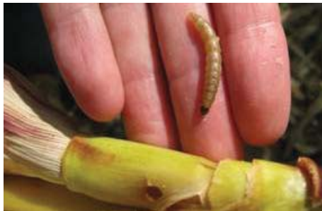
Boorgat in kolfsteel