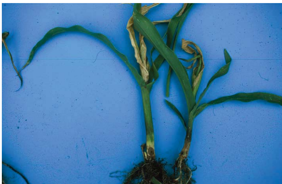
Schade door ritnaalden

Ritnaaldenschade kan men voorkomen door zaaizaad te gebruiken dat met thiacloprid (Sonido) is behandeld. De werking van dit middel is wel iets minder dan van de tot nu toe gebruikte middelen op basis van neonicotinoiden. Het is mogelijk om een test uit te voeren op de aanwezigheid van ritnaalden. Doorgesneden aardappelknollen kunnen begin april op 10 a 20 cm diepte in de grond gelegd worden. Na 10 tot 14 dagen kan men beoordelen of er ritnaalden in het perceel zitten.