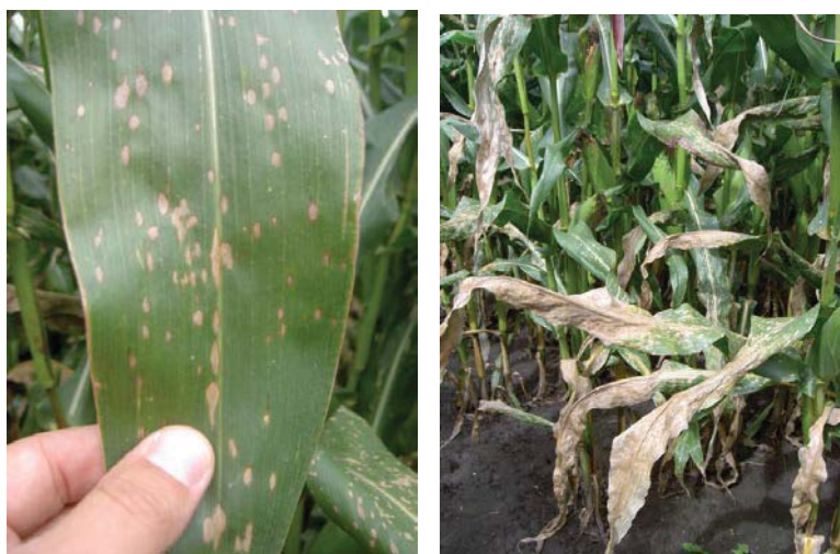
Aantasting door Helminthosporium carbonum