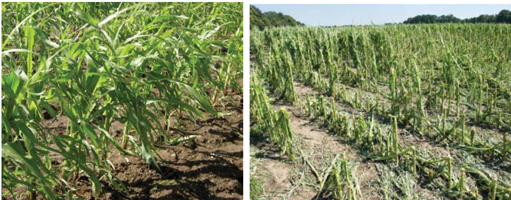
Licht en zware hagelschade

Hagelbuien kunnen forse schade aanrichten aan een maïsgewas. De schade kan dusdanig groot zijn dat herstel niet of nauwelijks meer mogelijk is. Lichte hagelschade is te herkennen aan gerafelde bladeren. De productie zal dan iets minder zijn en het gewas is mogelijk wat gevoeliger voor ziektes zoals bladvlekkenziekte. Wanneer in een jong stadium de bladeren kapot zijn gehageld maar het groeipunt is nog niet beschadigd zal het gewas zich herstellen. Wanneer in een later stadium naast de bladeren ook de mannelijke bloei en de kolfaanleg beschadigd zijn zal de productie fors lager zijn. Tegen hagelschade kan men zich verzekeren.