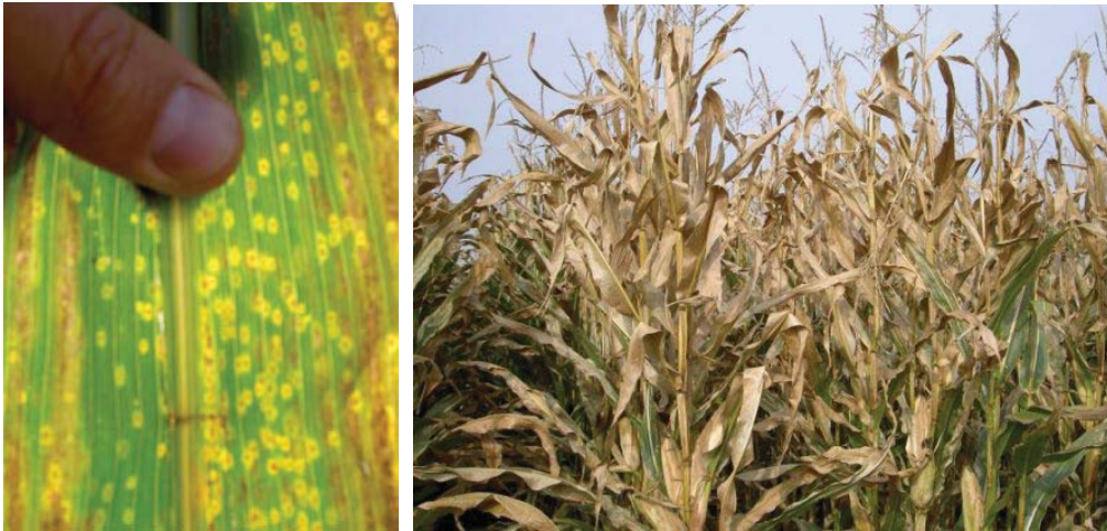
Aantasting door Eyespot