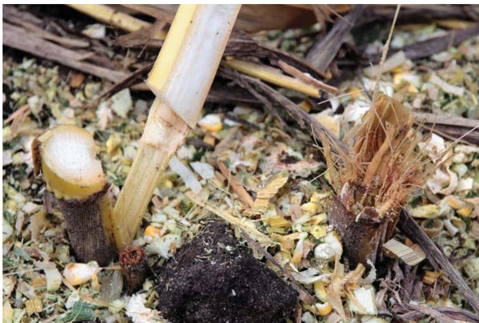
Rechts stengelrot, links gezonde plant

In gewasrotaties met graan en maïs is er mogelijk verhoogde kans op aantasting door Fusariumschimmels. Bij beide gewassen is er vervolgens een hogere kans op mycotoxinen (mn DON en ZEA), Gewasresten onderploegen zou enig remmend effect kunnen hebben op de ontwikkeling van Fusarium.