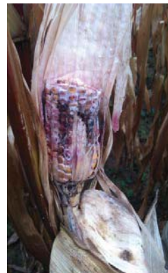
Schimmelvorming op kolf