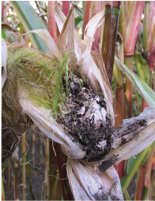
Harige schimmelbol op plaats van de kolf

Later in het seizoen gaan de schimmelbollen sporenvormen. De bollen gaan open en de sporen vallen op de grond of worden door de wind naar buurtpercelen verspreid. Bij zware aantasting zullen de sporen bij het hakselen een zwarte stofwolk om de hakselaar vormen. Ook dan vindt via de wind en de machines weer verspreiding plaats.