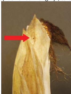
Boorgat in schutblad

worden gebruikt. Het is daarom verstandig om zwaar aangetaste mais, waarbij zich veel schimmels op de kolf aanwezig zijn, te laten onderzoeken op mycotoxinen.