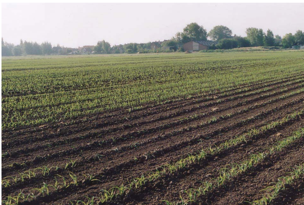
Roeken kunnen aanzienlijke schade aanrichten wanneer zaaizaad niet is behandeld

Vlak na het zaaien kunnen vogels schade aanrichten, zoals duiven, fazanten, kauwen, roeken en zwarte kraaien. Zowel zaden als jonge planten kunnen weggepikt worden. In extreme situaties kunnen de vogels hele percelen wegvreten. De kans op vogelvraat is kleiner door dieper te zaaien (5-6 cm) en door geen zaad te morsen. Indien het zaaizaad behandeld is met methiocarb (Mesurol FS FS), geeft dit voldoende bescherming tegen vogelschade. Zie voor meer info over vogelvraat beperken bij onbehandeld zaad hoofdstuk 7.2.