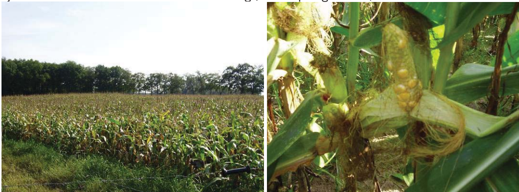
Droogte tijdens de bloei leidt tot een slechte korrelzetting

Droogteschade uit zich op verschillende wijzen. Afhankelijk van het ras kan het blad gaan krullen. Bij andere rassen krullen de bladeren niet, maar gaat veel van het onderste blad verloren. Droogte tijdens de bloei leidt tot een slechte korrelzetting (zie ook paragraaf 3.7).