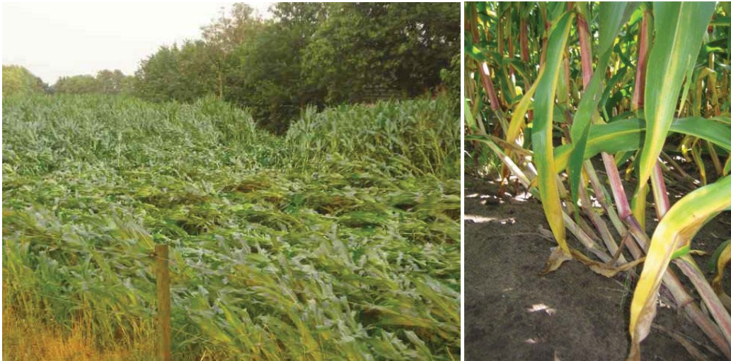
Platgewaaide maïs tijdens het seizoen groeit vaak weer met een boog omhoog (ganzennek)