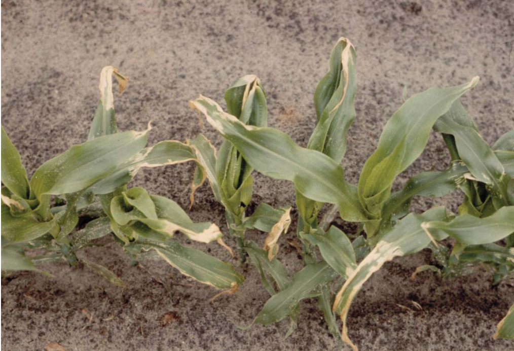
Schade bij bemesting na opkomst

groei seizoen gegeven moet worden, is het aan te bevelen om dit in de vorm van een rijenbemesting te doen.