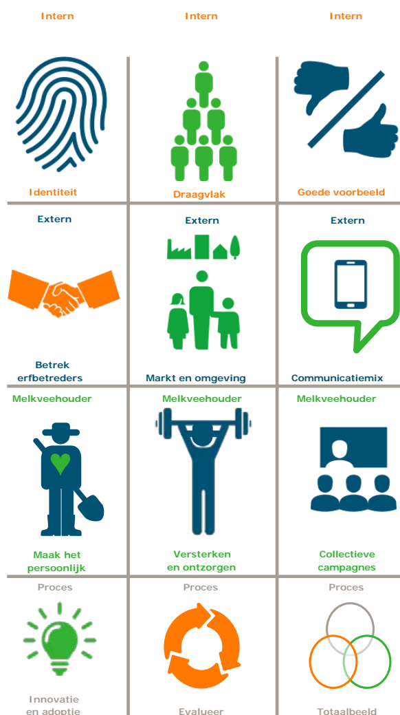
Figuur 3. Overzicht van thema's die van belang zijn wanneer een keten werkt aan verduurzaming

Figuur 3 is gebruikt tijdens workshops met verwerkers en laat zien welke thema's van belang zijn wanneer een keten werkt aan verduurzaming.