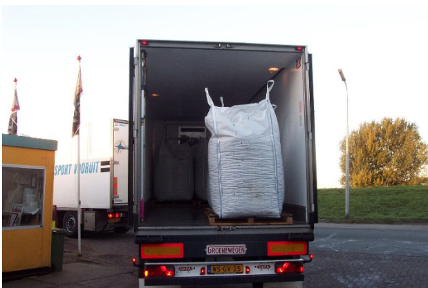
Figuur 1: Mosselen op transport in big-bags.

De mosselen die in Nederland worden gekweekt worden over het algemeen verhandeld aan de veiling in Yerseke. Het transport van de mosselen naar de veiling gaat doorgaans via het ruim van een mosselkotter of in big-bags via een (gekoelde) vrachtwagen (Figuur 1). De keuze tussen de boot en vrachtwagen is vaak afhankelijk van de afstand en de hoeveelheid mosselen die worden getransporteerd. De duur van het transport varieert van een paar uur tot maximaal 2 dagen (Wijsman en Smaal, 2006).