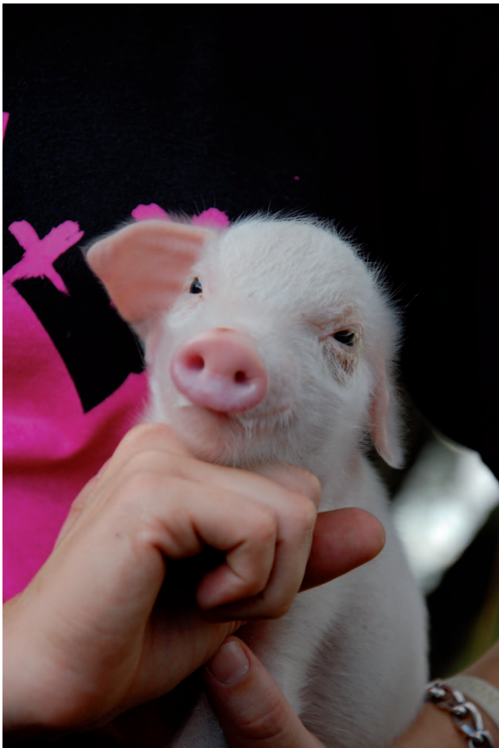
Stress bij een jonge big kan effect hebben op de immunocompetentie van het varken in het latere leven.

onderzoeksprogramma's F4F-VDI en F4F-MMM bieden in de toekomst meer aanknopingspunten om via de voeding de weerbaarheid van landbouwhuisdieren tegen invloeden van buiten te verbeteren. ■