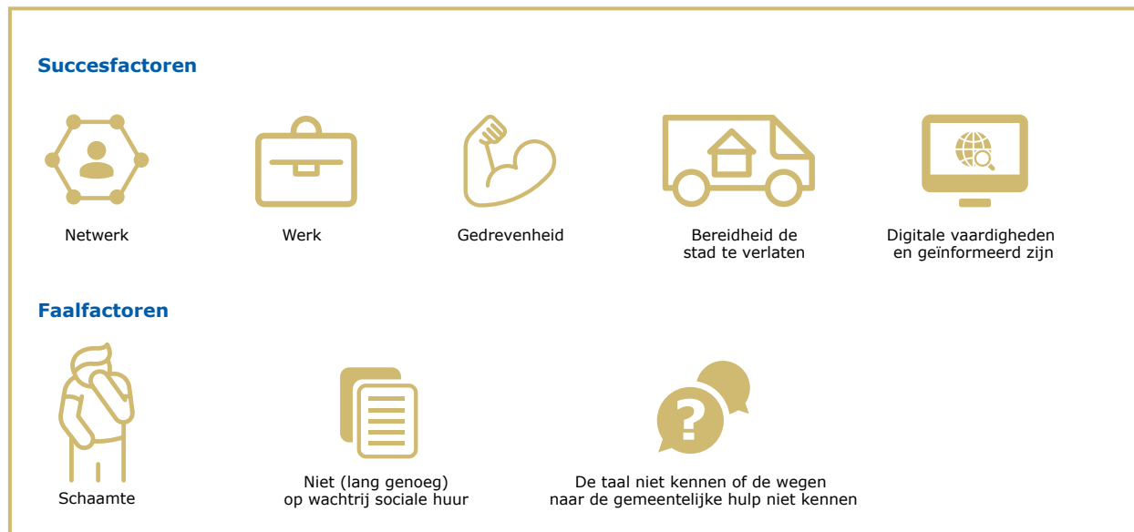
Figuur 3 Succes- en faalfactoren in het potentieel van tijdelijke oplossingen

groot, zullen de maatschappelijke kosten van tijdelijke onderdak lager zijn dan de kosten voor de hulpverlening wanneer een persoon langere tijd dakloos is. De neerwaartse spiraal van dakloos raken en afglijden op de sociale ladder is overigens niet alleen kostbaar voor de maatschappij, maar gaat ook in tegen het recht op woonplaats. Echter, wanneer tijdelijk onderdak niet effectief blijkt, dan is onderdak in bijvoorbeeld een hotel een zeer kostbare oplossing.