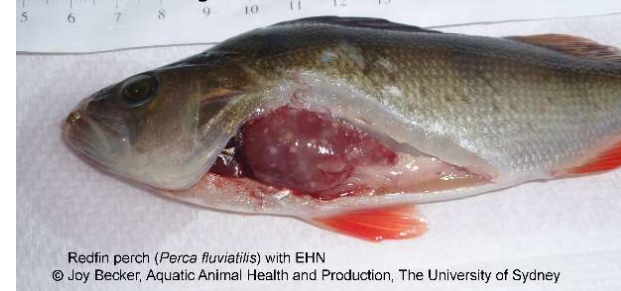
Redfin perch ( Perca fluviatilis ) with EHN

NB. Inwendig o.a. vergrote lever met wit-gelige haarden van afgestorven weefsel