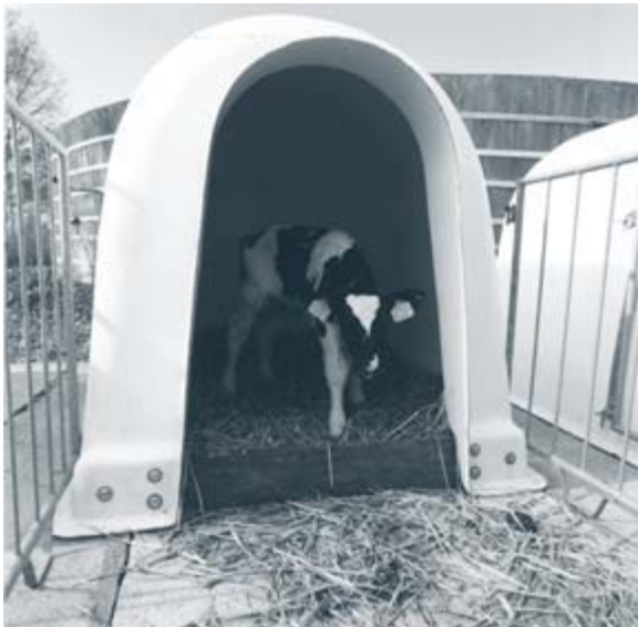
Dierenwelzijn begint met een goede gezondheid. De kalveriglo draagt hieraan bij, het verlaagt de infectiedruk.

Ten slotte hebben veehouders ook een verantwoordelijkheid wat betreft het dierenwelzijn bij de afvoer van dieren. Dieren die voor afvoer worden bestemd moeten namelijk 'fit to travel' zijn. In de regelgeving is vastgelegd dat dieren die bijvoorbeeld ernstig kreupel zijn of ernstige uierontsteking hebben, diepe wonden hebben of vlak voor of na afkalven zitten niet getransporteerd mogen worden. Bij twijfel kan de dierenarts worden geraadpleegd.