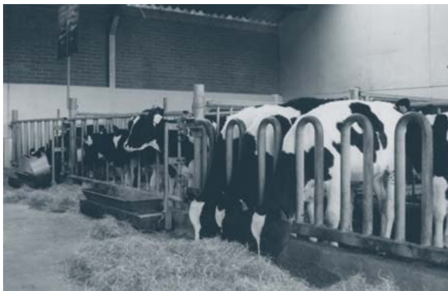
Gescheiden jongveehuisvesting verkleint de kans op besmetting met Paratuberculose.

Bedrijven met een A-status kunnen voor bewaking volstaan met tweejaarlijks individueel bloed of melkonderzoek. De andere bedrijven moeten dit onderzoek jaarlijks laten uitvoeren. In het eerste kwartaal van 2018 had 75% van de melkveebedrijven status A.