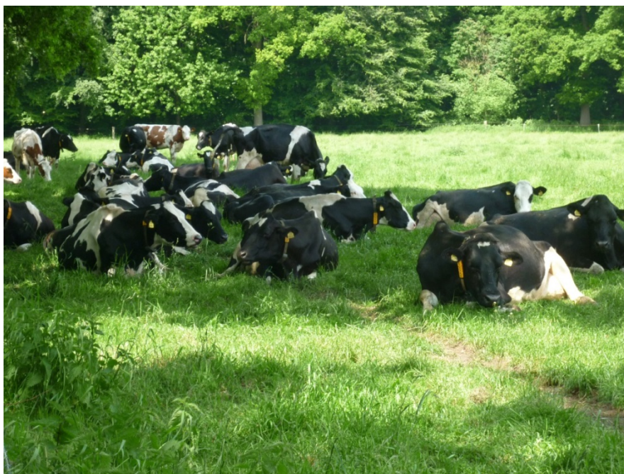
Weidegang draagt bij aan natuurlijk gedrag van koeien

Voor beoordeling in welke mate aan de genoemde vijf vrijheden wordt voldaan zijn beoordelingscriteria nodig. In het Europese onderzoeksprogramma Welfare Quality zijn deze vrijheden daarom vertaald in vier basisprincipes: goede voeding, goede huisvesting, goede gezondheid en normaal gedrag. Hieraan zijn een twaalfstal welzijnsriteria gekoppeld (tabel 8.2) waarop het welzijn beoordeeld kan worden.