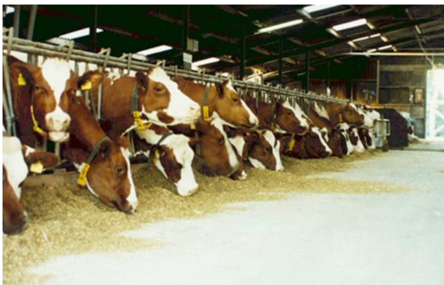
Bestendig zetmeel is goed voor productie in eerste fase van lactatie.

Het zetmeelgehalte wordt sterk bepaald door het kolfaandeel. Naarmate de snijmaïs afrijpt, neemt het aandeel van de kolf in de drogestof toe. Bij toename van het drogestofgehalte is er dus een toename van het zetmeelgehalte. Per ras is dit verband verschillend. Om een goed beeld te krijgen van het verloop in zetmeelgehalte en in de rasvolgorde hierin, is het daarom gewenst zowel het zetmeelgehalte bij oogst, als bij het voor snijmaïs optimale dsgehalte van 35% weer te geven. Bij zetmeel kan men afhankelijk de specifieke bedrijfssituatie kiezen voor een hoog of laag gehalte aan zetmeel. In Nederland gaat de voorkeur overwegend uit naar een hoog gehalte (bestendig) zetmeel. Voor de vergelijking van rassen op het zetmeelgehalte zal moeten worden in geschat, welk drogestofgehalte de maïs op het betreffende perceel kan bereiken. Gedurende het groeiseizoen kan men afhankelijk van de kolfontwikkeling het uiteindelijke zetmeelgehalte sturen door vroeger of later te oogsten. Bij zeer vroege rassen, die eerder in het groeiseizoen een bepaald drogestofgehalte bereiken, is de mogelijkheid te sturen groter dan bij middenvroege rassen.