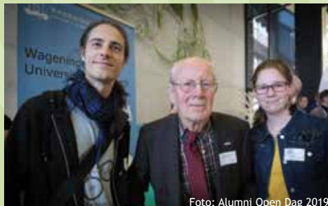
Foto: Alumni Open Dag 2019

De tweede Alumni Open Dag op Wageningen Campus.