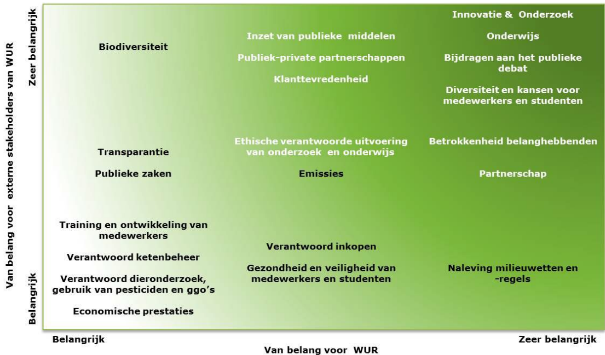
Figuur 1: Materialiteitsanalyse