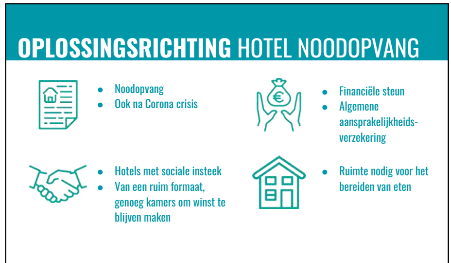
Figuur 1 Voorwaarden van de Oplossingsrichting Hotel Noodopvang