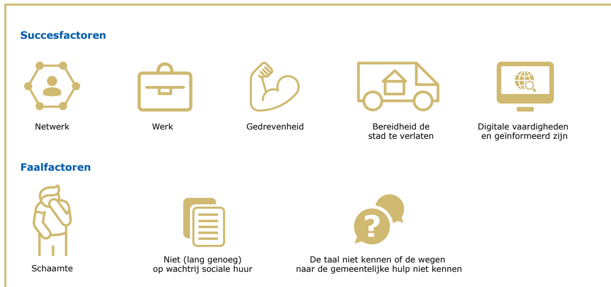
Figuur 3 Succes- en faalfactoren in het potentieel van tijdelijke oplossingen

groot, zullen de maatschappelijke kosten van tijdelijke onderdak lager zijn dan de kosten voor de hulpverlening wanneer een persoon langere tijd dakloos is. De neerwaartse spiraal van dakloos raken en afglijden op de sociale ladder is overigens niet alleen kostbaar voor de maatschappij, maar gaat ook in tegen het recht op woonplaats. Echter, wanneer tijdelijk onderdak niet effectief blijkt, dan is onderdak in bijvoorbeeld een hotel een zeer kostbare oplossing.