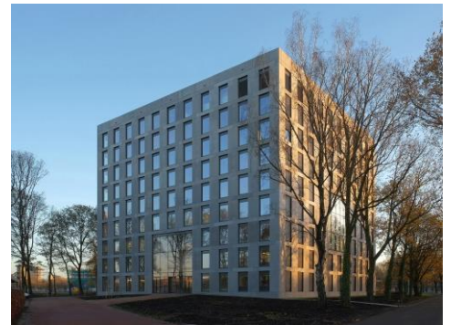
Vooraanzicht van het Helix gebouw

Bij aankomst graag wachten in de hal bij de receptie tot iemand van het onderzoeksteam u ophaalt.