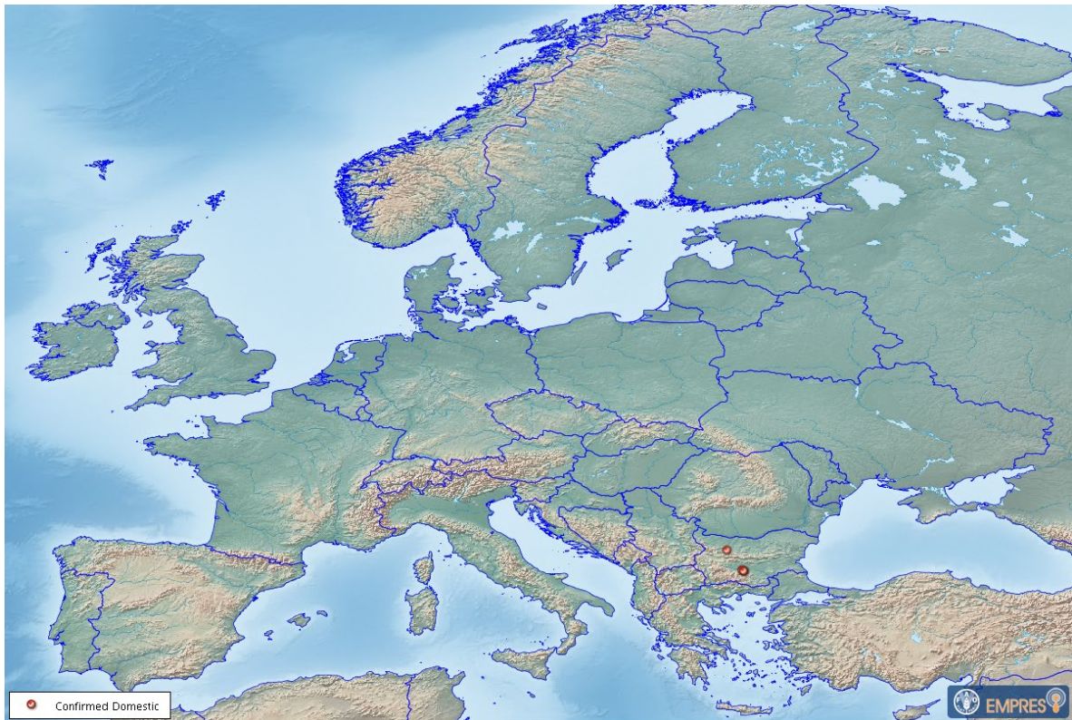
Figuur 3 Overzichtskaart van de HPAI meldingen van pluimveebedrijven en wilde vogels in de periode van 01-04-2019 t/m 23-09-2019 in Europa.