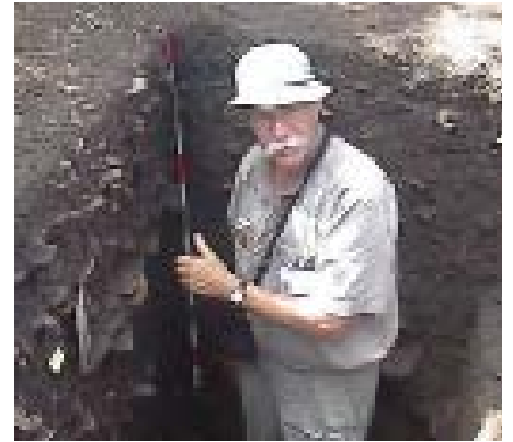
FOTO 2: SOMBROEK IN TERRA PRETA KUIL.

'De Terra preta heeft heel levendig onderzoek opgeleverd. En de bodem is een mooi voorbeeld van hoe de mens de bodemkwaliteit positief kan beïnvloeden, net als bij de terpbodem en de eerdgronden'.