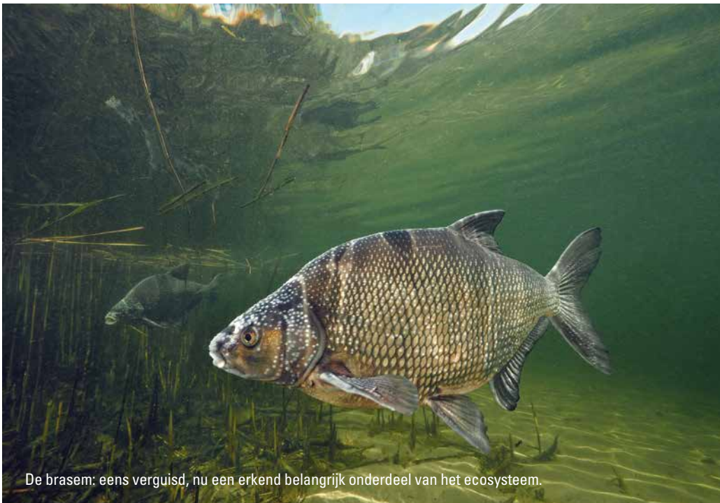
De brasem: eens verguisd, nu een erkend belangrijk onderdeel van het ecosysteem.

“De visserijmodellen leveren informatie voor een visplan, maar voor draagvlak voor de uitkomsten van een model moet je praten over hoe ze in elkaar steken”, aldus De Leeuw. “Dat is ingewikkeld, want de werking van visserijmodellen breng je niet zomaar over in een workshop op vrijdagmiddag. Het is voor mij ook een vraag: hoe communiceer je hierover op begrijpelijke manier, ook over onzekerheden? En hoe zit het nu eigenlijk onder water en waar zitten de vraagtekens? Uiteindelijk wil je tot een gedeelde werkelijkheid komen.” Volgens De Leeuw zijn er altijd stevig fluctuerende visbestanden geweest in het IJssel- en Markermeer, maar is het voedselweb de laatste tien jaar opvallend inefficiënt geworden. “Het gaat niet goed met de vis, maar het is niet hopeloos. Ik geloof in het motto dat voor iedereen een mooie visserij mogelijk is. De komende jaren gaan we werken aan een visplan waarvan alle partijen straks hopelijk zeggen: dat is zo gek nog niet. Dit project is een platform dat naast de bestuurlijke werkelijkheid staat, zonder directe consequenties. Zo kun je zonder politieke druk samen met vissers en natuurbescherming dingen out of the box bespreken en onderzoeken. Ik ben heel benieuwd wat daaruit gaat komen.” ■