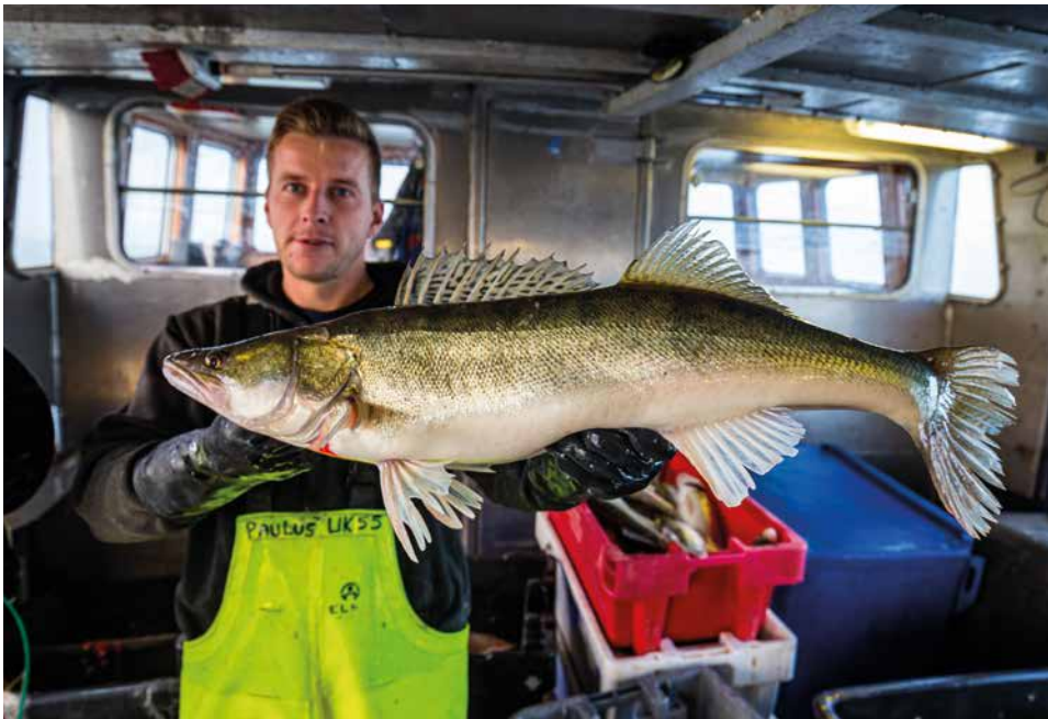
De laatste jaren is er niet alleen meer, maar vooral ook grotere snoekbaars aangeland.

we kijken naar data over de visstanden en beheerdoelen. De uitkomst wordt verwerkt in een fictief visplan, dat we later vergelijken met de werkelijke gang van zaken. Zo kan het visplan verder evolueren.”