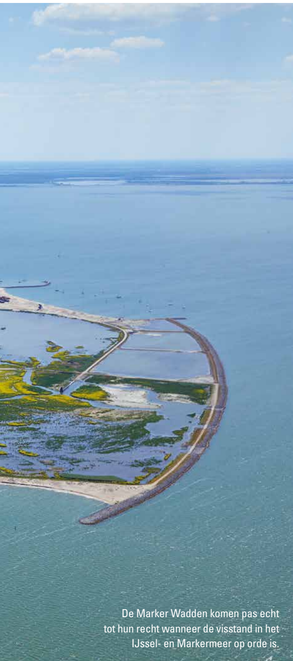
De Marker Wadden komen pas echt tot hun recht wanneer de visstand in het IJssel- en Markermeer op orde is.