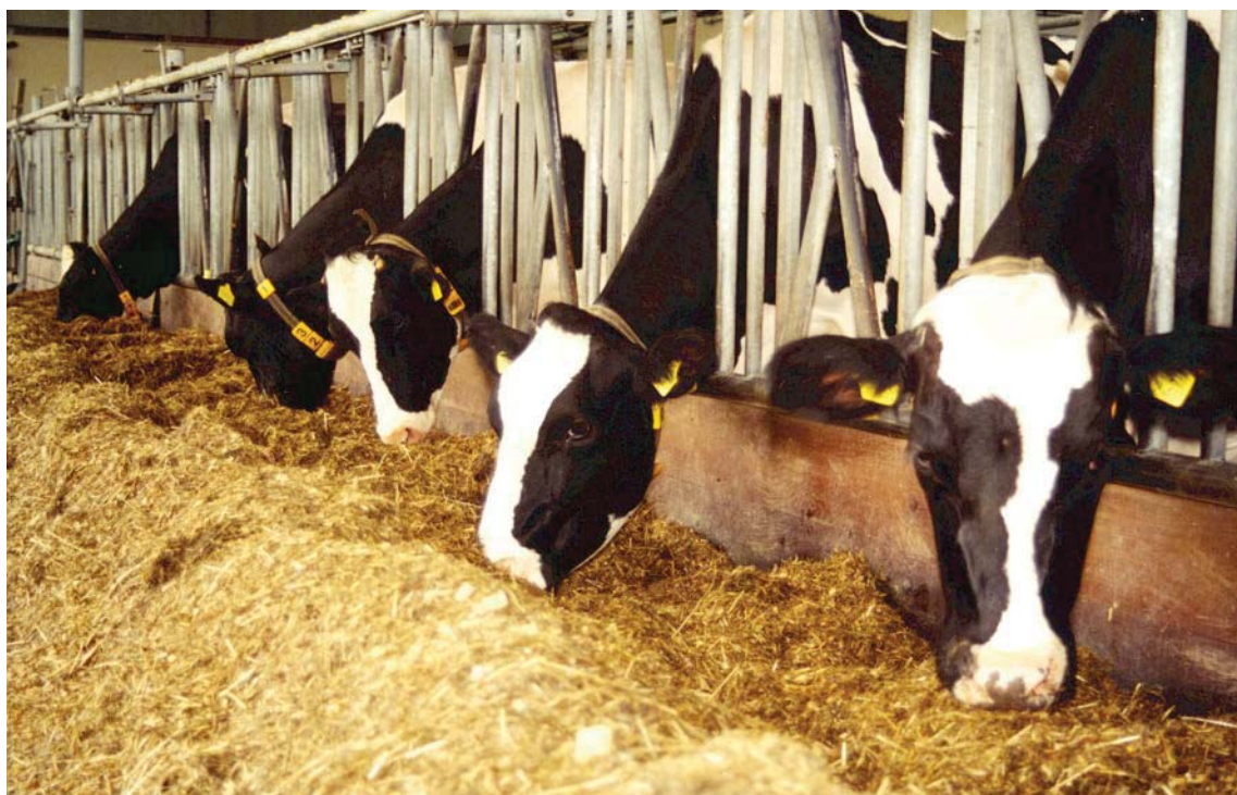
Goede voeropname met snijmaïs