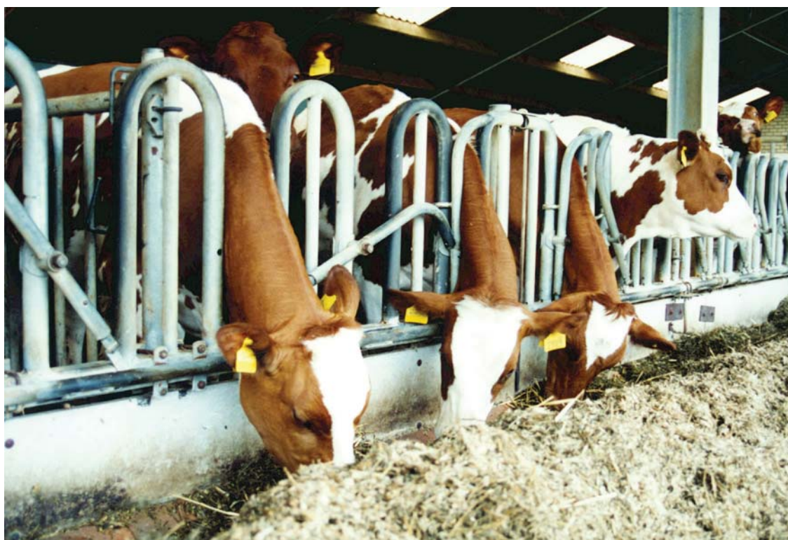
Grotere kans op vervetting bij jongvee met veel snijmaïs

Snijmaïs past ook goed in rantsoenen voor jongvee, maar ook hier bestaat een risico voor vervetting. Bij jongvee jonger dan 1 jaar dat naast ruwvoer nog (eiwitrijk) krachtvoer krijgt, kan men snijmaïs als enig ruwvoer gebruiken. Bij het oudere jongvee moet de hoeveelheid snijmaïs worden beperkt tot maximaal 40% van het ruwvoer.