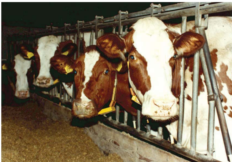
Uitsluitend snijmaïs voor melkkoeien op Cranendonck van 1986-1991

Onder sommige specifieke bedrijfsomstandigheden kan het een optie zijn om uitsluitend snijmaïs als ruwvoer te gebruiken, bijvoorbeeld als er geen of een te kleine huiskavel is of wanneer er geen of te weinig grond beschikbaar is voor ruwvoerproductie. Op praktijkcentrum Cranendonck is een systeemvergelijking uitgevoerd tussen een bedrijfssysteem met gras en snijmaïs en systeem met uitsluitend snijmaïs.