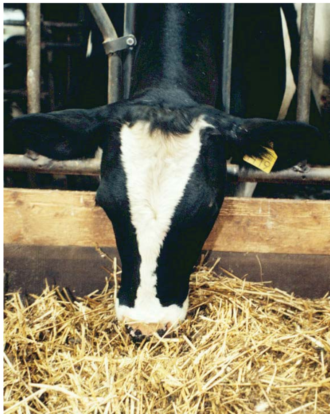
Stro in het rantsoen kan structuurgebrek opheffen

Wanneer een rantsoen onvoldoende structuur bevat, verdienen andere maatregelen de voorkeur boven grof hakselen, vroeg oogsten of het telen van een ras van het celwandtype. Bijvoorbeeld het verlagen van het aandeel krachtvoer(vervangers) in het rantsoen of een andere krachtvoersamenstelling met minder snel afbreekbare koolhydraten. Ook een verlaging van het aandeel snijmaïs in het rantsoen ten gunste van bijvoorbeeld graskuil, of het opnemen van hooi of stro in het rantsoen kunnen het structuurgebrek opheffen.