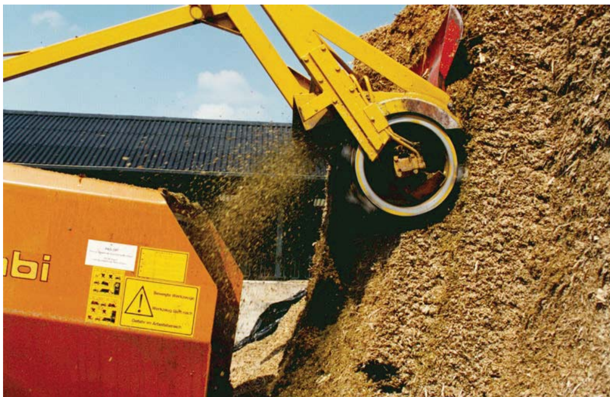
Snijmaïs dankt zijn hoge voederwaarde met name aan het hoge zetmeelgehalte