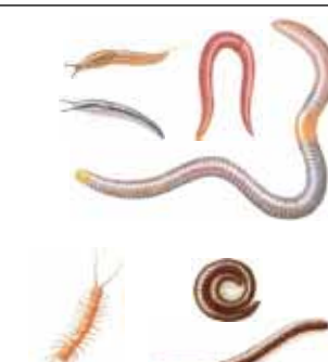
Stekken en regenwormen