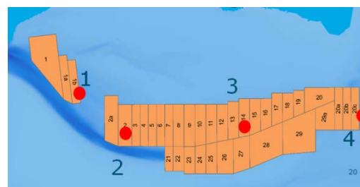
Figuur 3: Groei van mosselen (bustal over de tijd, bovenste figuur) op verschillende locaties (onderste figuur) over het perceelblok in een geul onder Terschelling (KOMPRO)

Zoutgehalte: hoewel lage zoutgehaltes de predatie van zeesterren kan verminderen, leiden lagere zoutgehaltes ook tot een verminderde groei van de mosselen (Maar, Saurel, Landes, Dolmer, & Petersen, 2015). Percelen die richting Den Oever of Harlingen liggen zijn hierom minder productief.