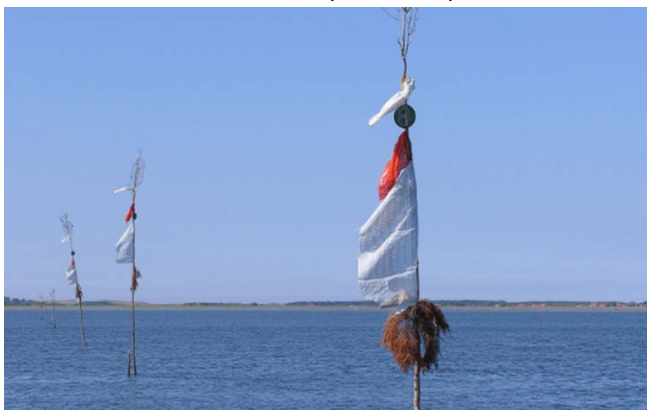
Figuur 1: Staken markeren de grens van een perceel

Bij het in gebruik nemen van nieuwe percelen (bijvoorbeeld wisselpercelen) is het van belang dat de kweker vooraf kan inschatten wat de productiepotentie is van de nieuwe locatie. Het kan daarbij helpen als de factoren die de kwaliteit van een perceel bepalen duidelijk zijn. In deze folder wordt op basis van beschikbare kennis en ervaring een overzicht gegeven van de factoren die de kwaliteit van een perceel bepalen.