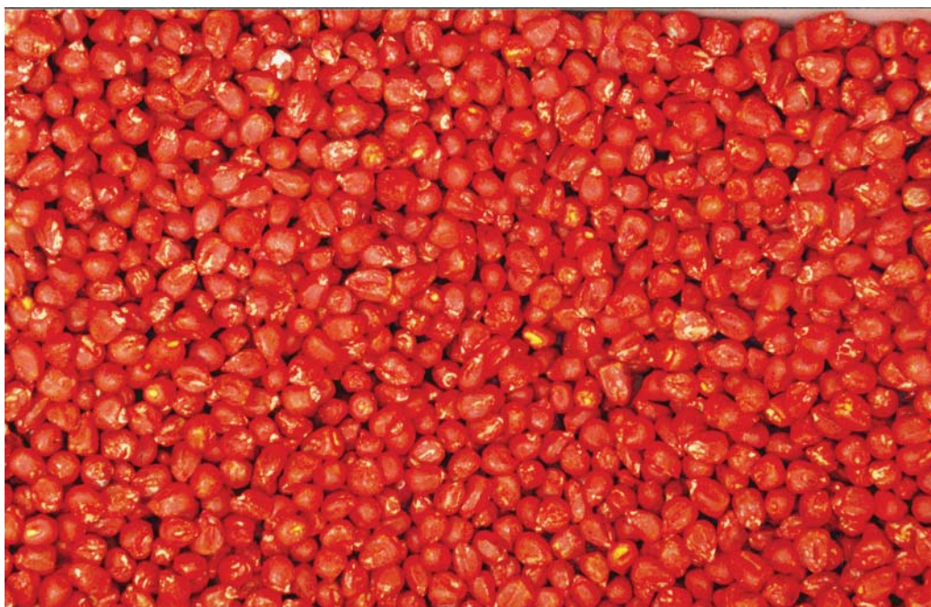
Begin met goed zaad

De veldopkomst is niet alleen afhankelijk van de kiemkracht. Dit komt doordat de kiemingsomstandigheden in het veld vaak veel ongunstiger zijn dan in het laboratorium. Maïs krijgt tijdens de kieming nogal eens te maken met lage temperaturen, waardoor de veldopkomst sterk kan afwijken door inwerking van kiemschimmels. Daarom adviseren we om bij vroeg zaaien meer zaden per ha te gebruiken dan bij later zaaien (zie paragraaf 7.5).