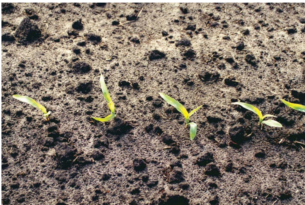
Kies de juiste zaaidichtheid