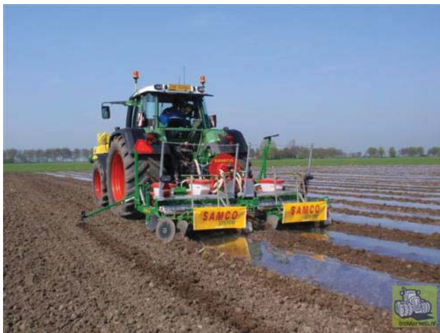
Maïs gezaaid onder folie ontwikkelt zich sneller

In onder andere Amerika past men dit toe om op berghellingen erosie tegen te gaan en om te kunnen irrigeren. Achterliggende gedachte voor Nederland is om onder natte omstandigheden langer te kunnen oogsten door over de ruggen te rijden. Daarnaast zou het de mineralenbenutting kunnen verbeteren doordat de vruchtbare grond naar de maïs wordt gebracht. Er zijn met dit systeem op beperkte schaal ervaringen opgedaan. Onderzoeksgegevens uit Denemarken laten erg wisselende resultaten zien. In 2009 is er door Wageningen Plant Research – Praktijkonderzoek AGV samen met Wageningen Livestock research onderzoek gestart met verschillende grondbewerkingsmethoden, waaronder ruggenteelt, op kleigrond. De opbrengst resultaten waren wisselend.