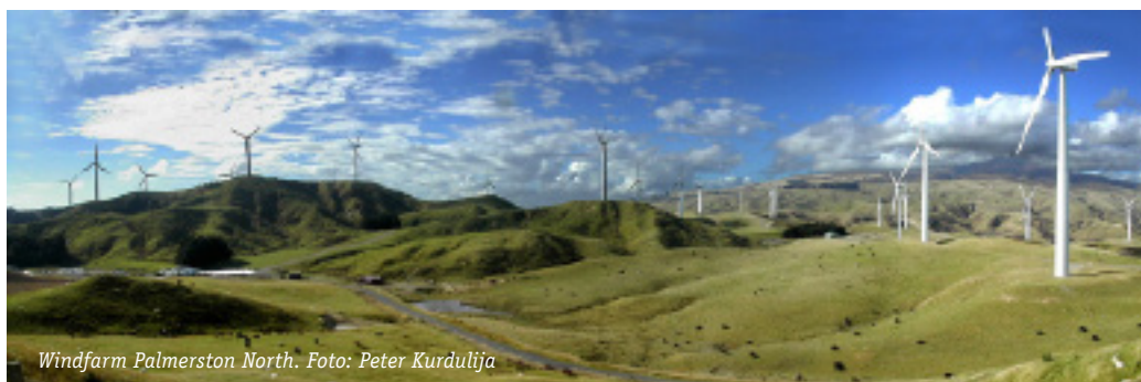
Windfarm Palmerston North.

De wet begint helaas dus niet met het duurzaamheidsbeginsel als juridisch hoofdbeginsel waaraan alle besluiten aan zouden moeten voldoen. Het bestuur en de rechter kunnen dus niet corrigerend optreden als bijvoorbeeld een toets niet-duurzaam uitvalt. Zo kan bijvoorbeeld de habitattoets vrij gemakkelijk windenergieproductie tegenhouden, terwijl je ook kunt verdedigen dat klimaatdoelen belangrijker zijn dan (sommige) natuurdoelen. De Nieuw-Zeelandse omgevingswet heeft hiervoor een simpele en effectieve juridische oplossing: aan de top van alle omgevingsregels »