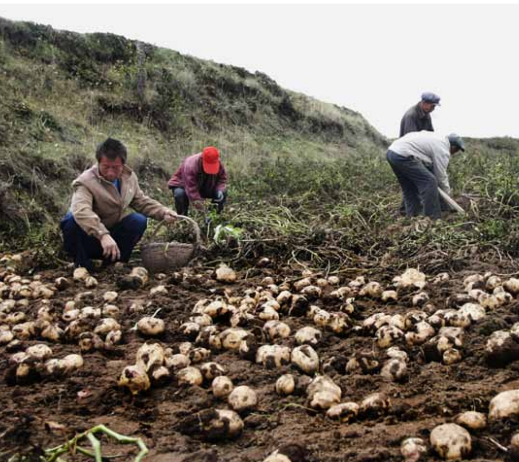
Aardappeloogst in China.