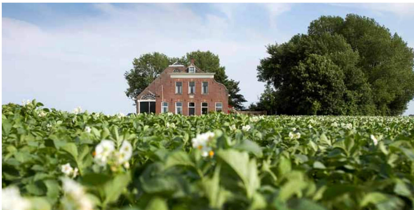
Een Nederlandse hectare kleigrond levert 70 ton aardappelen op, een record.