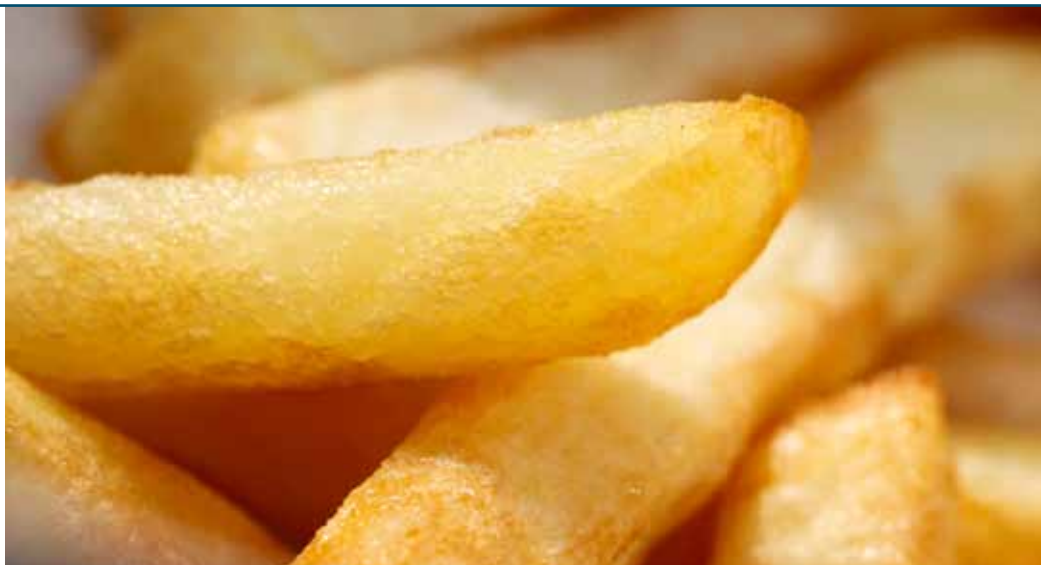
Er is maar één aardappelras geschikt voor biologische friet, voor biochips is er zelfs geen.

Ten tweede is het watergehalte een punt. Een aardappel is gaar als het water is verdampt. Hutten: 'Dat proces moet niet te lang duren, want tijd is geld. Daarnaast wordt een deel van dat water vervangen door olie. Gaat er veel olie in het aardappelproduct zitten, dan wordt het zowel vetter als slechter bewaarbaar. Zit er te weinig water in en te veel zetmeel, dan wordt het product na het bakken te hard. Het zetmeel- en watergehalte moeten dus binnen een bepaalde bandbreedte zitten.' Tot slot is de vorm belangrijk. 'Voor chips wil je ronde aardappels hebben van niet meer dan vijf centimeter doorsnede. Dan krijg je mooi ronde chips, die ook niet zo groot zijn dat ze direct breken in de zak. Voor friet wil