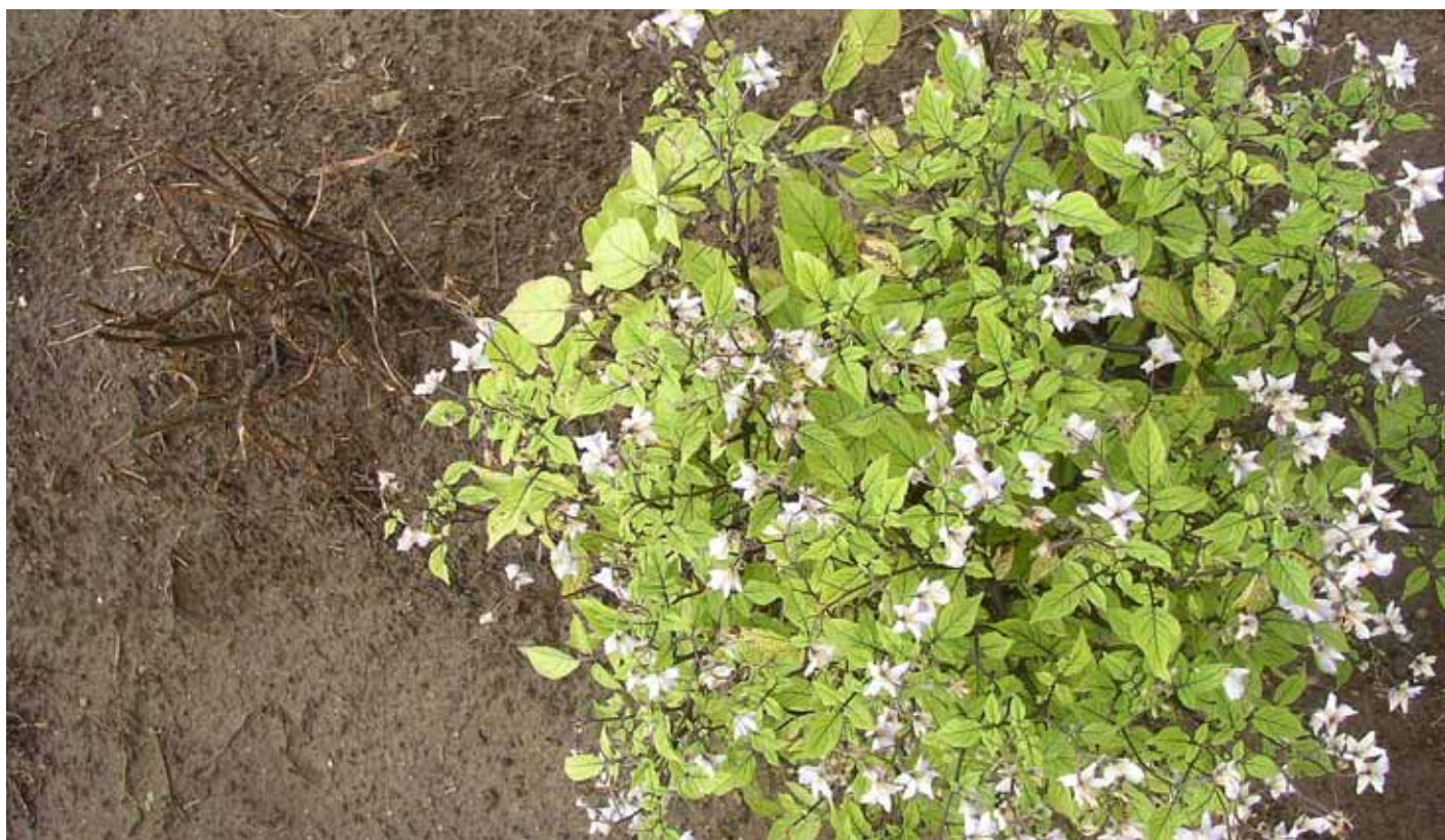
Wilde aardappel met resistentiegenen. De plant is onaangestast terwijl omringende commerciële aardappelplanten (links) volledig verwoest zijn door phytophthora.