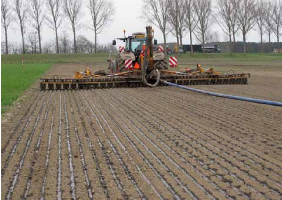
Aardapels bemesten zonder zware mesttank voorkomt bodemschade.

Aardappelen vragen een goede bodemstructuur. Maar bij het uitrijden van dierlijke mest in het voorjaar loert op kleigrond altijd het gevaar van bodemverdichting. In samenwerking met machinefabrikanten, loonwerkers en telers kijken onderzoekers naar hoe je toch goed bouwland voor aardappels op kunt.