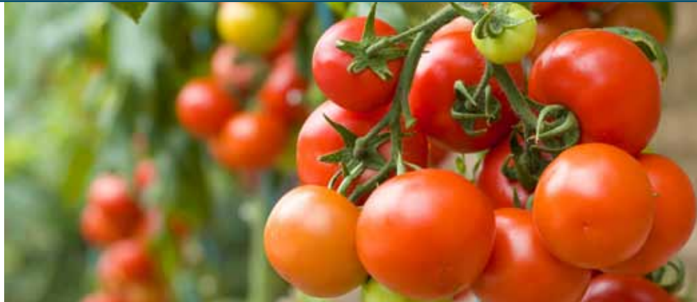
Tomaat en aardappel lijken genetisch erg op elkaar. Maar waarom produceert een tomaat toch geen aardappels?