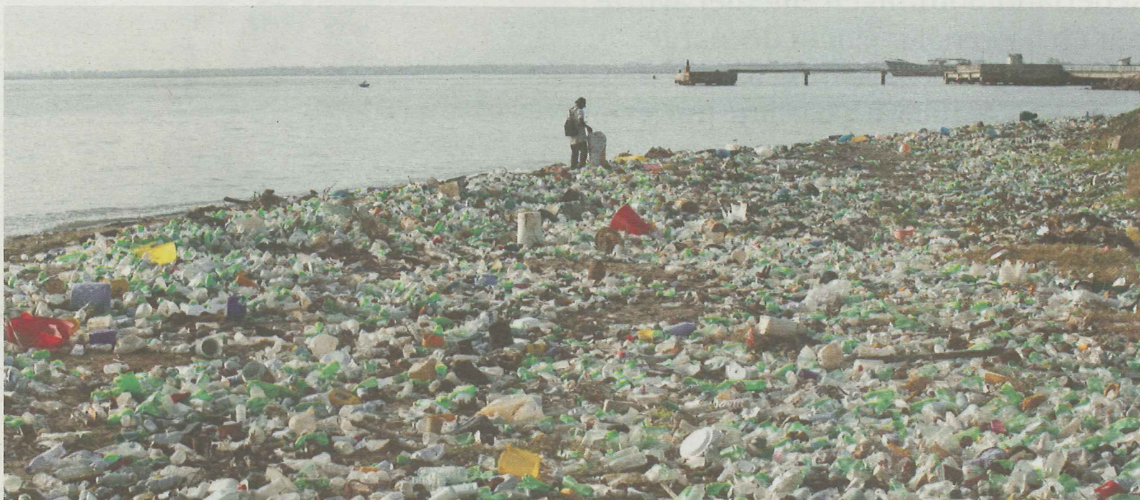
Een man verzamelt plastic flessen langs de kust van Cap Haitien, aan de noordkant van Haïti.

Andere onderzoekers maken gewag dat er nog drie vuilnisbelten drijven. Ook in de zuidelijke Stille Oceaan, niet ver van de Chileense