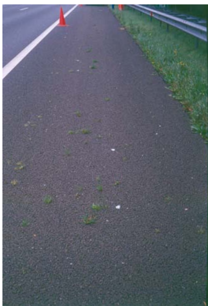
Figuur 3.1 Overzicht van proefstrook op A-12.

De beoordeling van effecten van verkeer op kruidengroei op de vluchtstrook is vooral gedaan aan de hand van waarnemingen aan de graspollen van Veldbeemd op de telvakken omdat deze relatief snel beoordeeld konden worden binnen de beperkte tijdspanne die beschikbaar was voor waarnemingen.