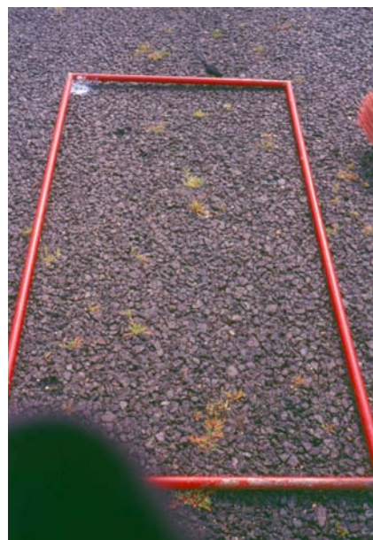
Figuur 2.2 Telvak in een proefveldje.