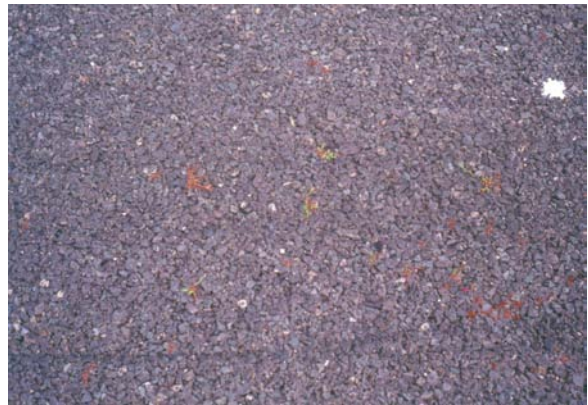
Figuur 2.4. Effect van strooizout op onkruiden op 10 juli.

Op 10 juli werden nauwelijks nog levende planten aangetroffen in de proefveldjes die behandeld waren met strooizout. Een enkele levende Varkensgrasplant werd nog aangetroffen in de strooizout-objecten (zie Tabel 2.3). Het effect op Varkensgras in het object strooizout was niet significant verschillend van het effect in de objecten strooizout in combinatie met eerst reinigen of borstelen. Een meerwaarde van reinigen of borstelen kon daarmee in deze proef niet aangetoond worden. In de proef was geen object reinigen of borstelen zonder strooizout opgenomen. Aanvullende waarnemingen aan deze maatregelen buiten de proefstrook toonden aan dat deze maatregelen zeer waarschijnlijk een verwaarloosbaar effect gehad zouden hebben op planten op de proefstrook.