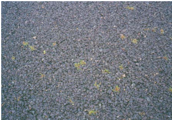
Figuur 2.3. Onkruiden op een proefveldje op de A-15 op 27 juni.

Gedurende de eerste week na toediening van de strooizoutoplossing is er een hoge mate van plantsterfte opgetreden. In Figuur 2.3 en 2.4 wordt het beeld van de onkruidsituatie voor en na behandeling getoond.