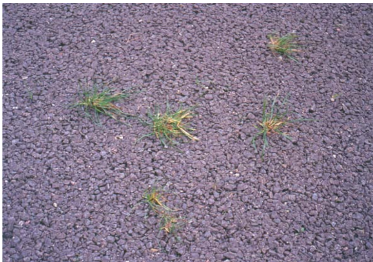
Figuur 3.2 Graspollen op de proefstrook langs de A-12 die beschadigd zijn door verkeer dat korte tijd over de proefstrook geleid is

Op 28 september, na de eerste keer dat verkeer over de vluchtstrook geleid was, werden beschadigingen geconstateerd aan de onkruiden op de vluchtstrook. Planten waren in meer of mindere mate platgereden. De dichtheid van de planten was niet op het oog niet afgenomen. Soms waren planten zwaar beschadigd. In Tabel 3.2 staat de mate van beschadiging van Veldbeemdpollen aangegeven. Alle veldbeemdpollen toonden beschadiging. De mate van beschadiging was het grootst op de posities Buiten en Binnen waar de banden van het verkeer het meeste contact hebben met de vluchtstrook via de banden (zie Tabel 3.2). Figuur 3.2 toont enkele beschadigde graspollen op de proefstrook.