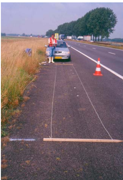
Figuur 2.1 Proefveldje op de vluchtstrook langs de A-15.

In Bijlage I staat een schematische weergave van hoe proefveldjes aangelegd zijn. In totaal waren er 16 proefveldjes. Ieder objecten (zie Tabel 2.1) werd getoetst op 4 proefveldjes. De objecten werden verloot over de proefveldjes volgens een blokkenproefschema en werden als zodanig statistisch geanalyseerd. De proefveldjes hadden elk een afmetingen van 10 meter lengte en 1 meter breedte. Veldjes werden gescheiden door een strook van 2,5 meter. Binnen ieder veldje werden twee telvakken van elk 0,5 m 2 gemarkeerd voor tellingen van onkruidplanten. Figuur 2.1 toont een veldje op de proefstrook. Figuur 2.2 toont een telvak.