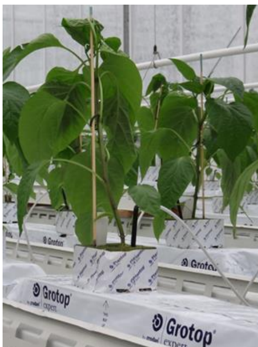
Teelt op steenwol