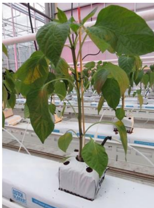
Teelt op kokos