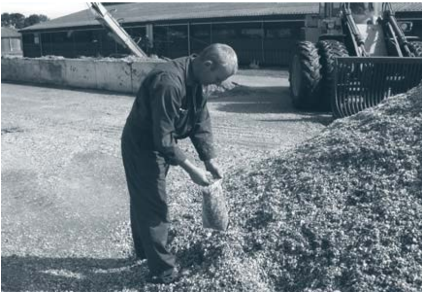
Bemonstering van verse snijmaïs voor bepaling van de voederwaarde.