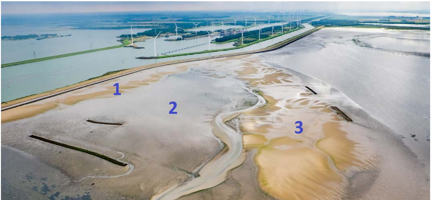
Oesterdam-suppletie op 6 september 2016. Dijkvoetsuppletie (1), centrale slik (2) en hoofdsuppletie (3). Verder zijn de vier kunstmatige oesterriffen zichtbaar. De kijkrichting is ZZO.

In de Oosterschelde is door de aanleg van de stormvloedkering (1986) en de bouw van de compartimenteringsdammen sprake van zandhonger. Recent uitgevoerde pilot-studies tonen aan dat lokale zandsuppleties een oplossing kunnen bieden voor dit probleem. Een tweeluik over het stillen van de zandhonger.