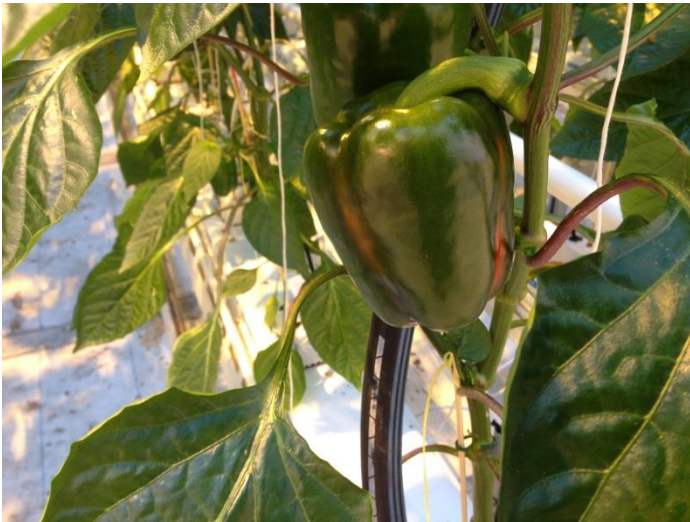
Teelt op kokos