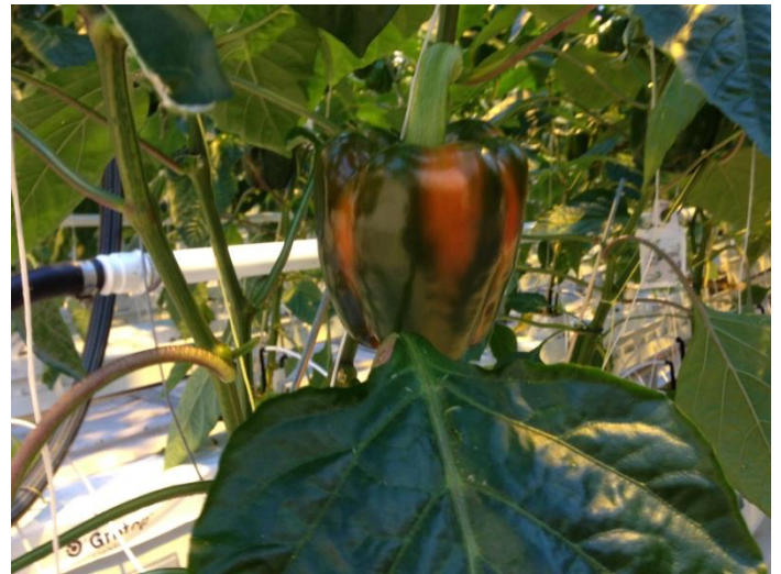
Teelt op steenwol