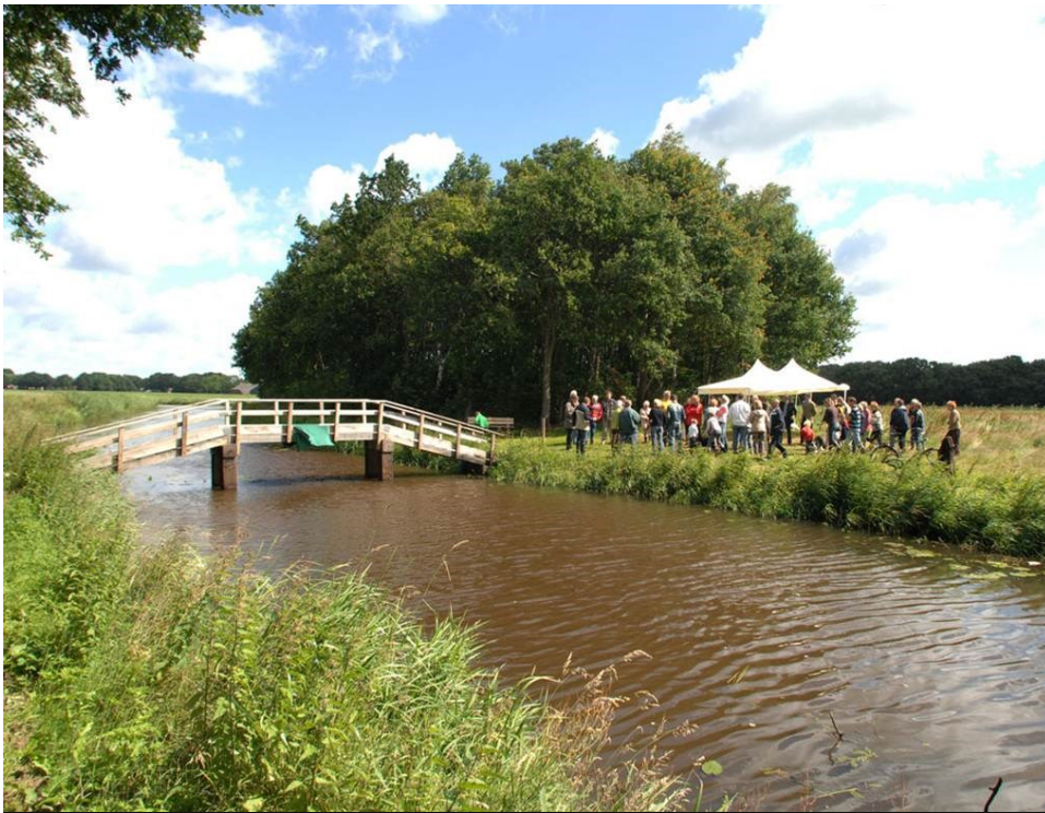
Burgerinitiatief Boermarke Essen en Aa's