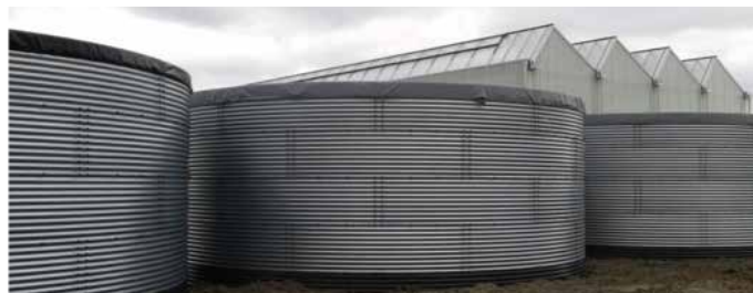
Silo's voor opslag hemelwater en testwater