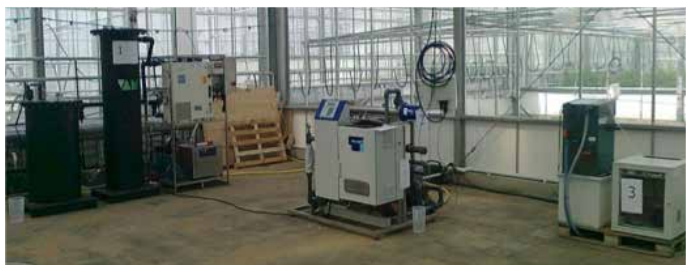
Zuiveringstechnologieën worden op praktijkschaal getest