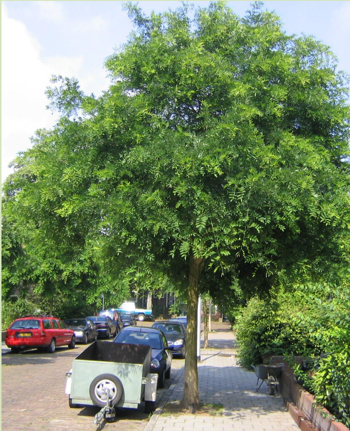
Nijmegen, Sleedoornstraat; zomer 2008, 11 jaar na het planten.