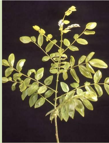
Twijg met samengesteld blad