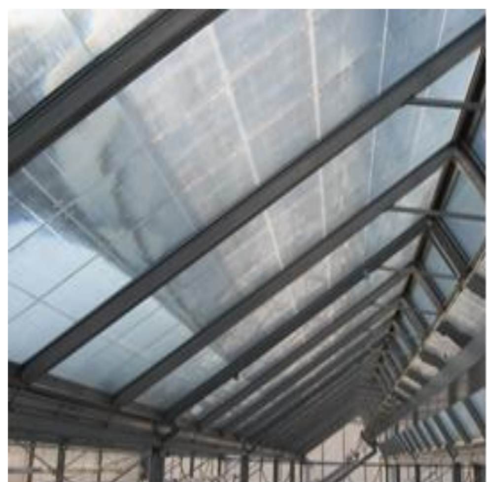
Figuur 2. Fresnellenzen in de zuidgevel.