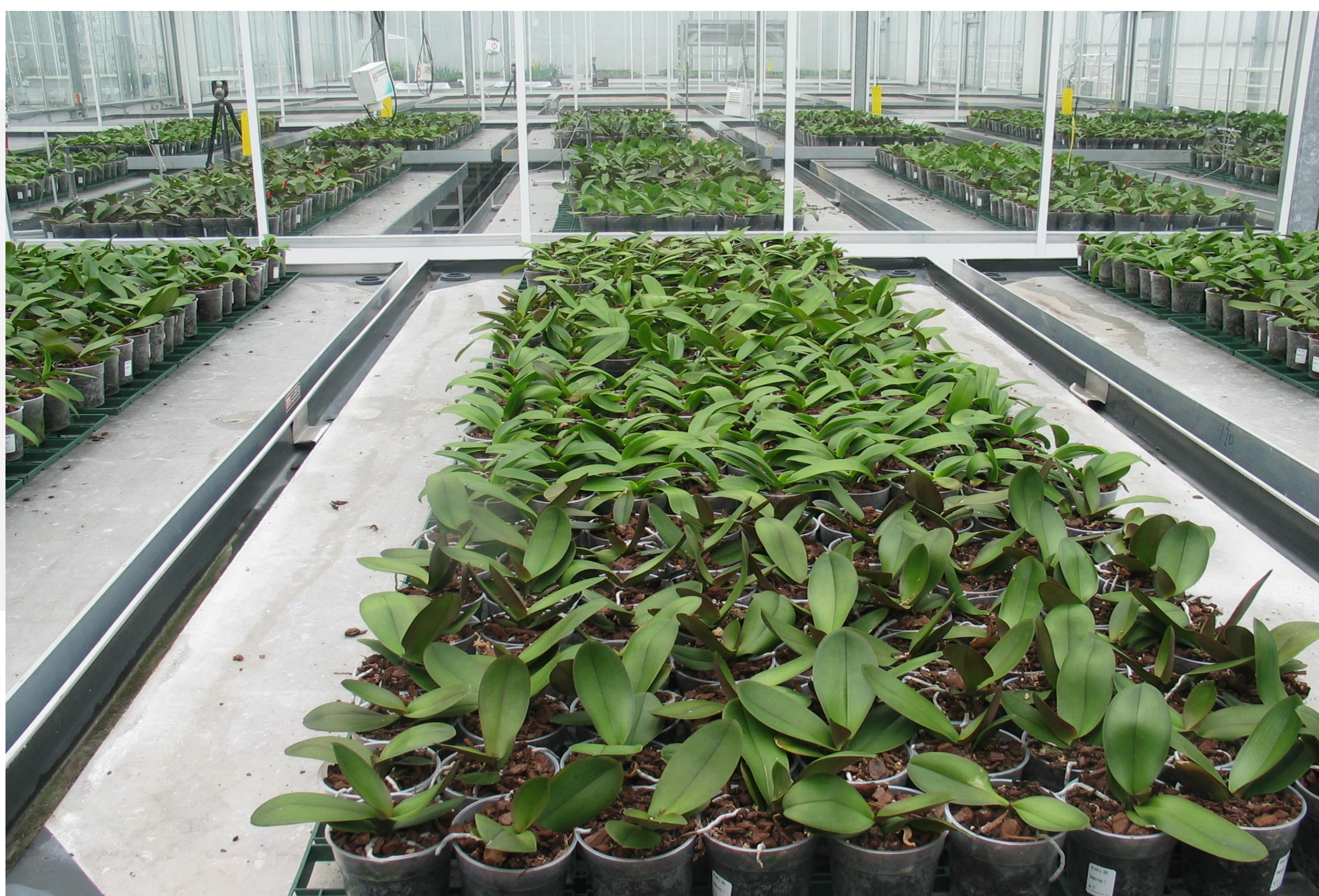
Figuur 1. Overzichtsfoto grip-op-licht vanuit de referentie afdeling.

Phalaenopsis (vanaf week 18, 2013) wordt geteeld in vier afdelingen. 1 referentie, 1 afdelingen met diffuus schermdoek , 1 afdelingen met diffuus kasdek en de daglichtkas . De daglichtkas is een kas met fresnellenzen in het dek die direct zonlicht focust en omzet in andere soorten energie. Gestuurd wordt naar 10 mol PAR licht/m 2 /dag. In koeling/afkweek is de temperatuur in de referentie gemiddeld een graad warmer dan de 'diffuse' behandelingen