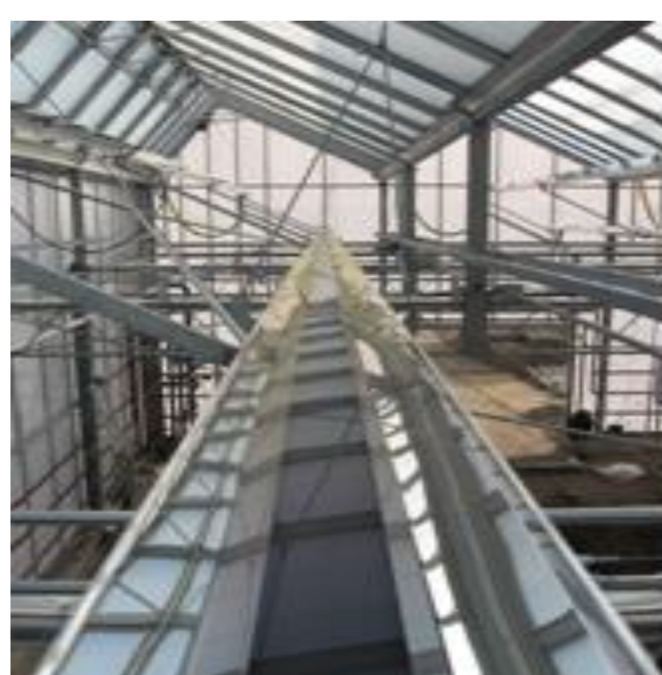
Figuur 3. Thermische collector voor de lichtbundel.