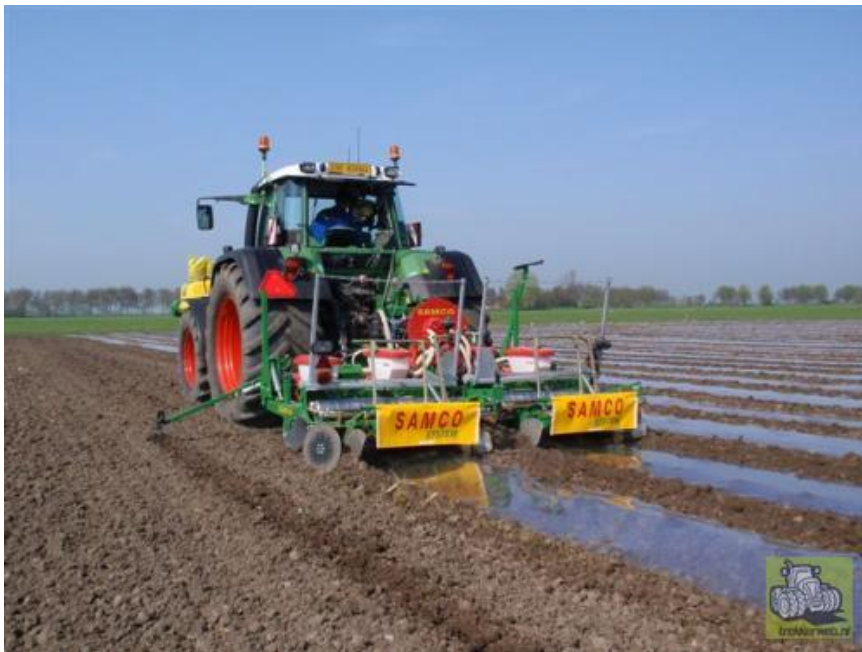
Maïs gezaaid onder folie ontwikkelt zich sneller

In onder andere Amerika past men dit toe om op berghellingen erosie tegen te gaan en om te kunnen irrigeren. Achterliggende gedachte voor Nederland is om onder natte omstandigheden langer te kunnen oogsten door over de ruggen te rijden. Daarnaast zou het de mineralenbenutting kunnen verbeteren doordat de vruchtbare grond naar de maïs wordt gebracht. Er zijn met dit systeem op beperkte schaal ervaringen opgedaan. Onderzoeksgegevens uit Denemarken laten erg wisselende resultaten zien. In 2009 is er door Wageningen UR Open teelten samen met Wageningen Livestock research onderzoek gestart met verschillende grondbewerkingsmethoden, waaronder ruggenteelt, op kleigrond. De opbrengst resultaten waren wisselend.