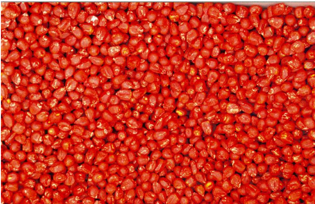
Begin met goed zaad

De veldopkomst is niet alleen afhankelijk van de kiemkracht. Dit komt doordat de kiemingsomstandigheden in het veld vaak veel ongunstiger zijn dan in het laboratorium. Maïs krijgt tijdens de kieming nogal eens te maken met lage temperaturen, waardoor de veldopkomst sterk kan afwijken door inwerking van kiemschimmels. Daarom adviseren we om bij vroeg zaaien meer zaden per ha te gebruiken dan bij later zaaien (zie paragraaf 7.5).