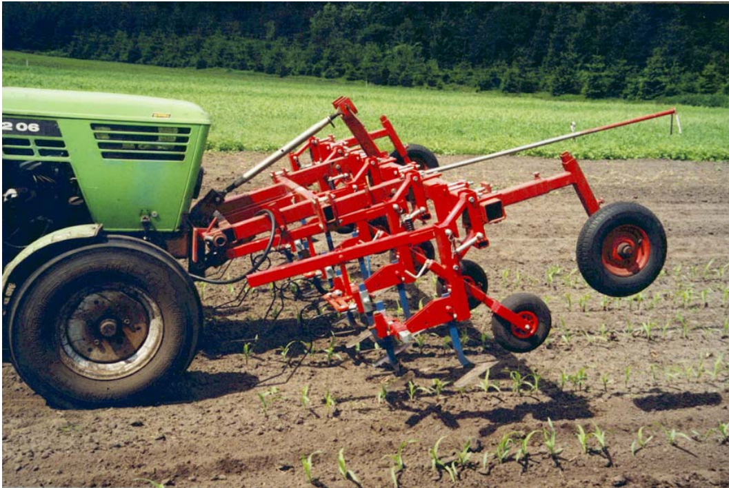
Frontschoffel met vaste schoffels