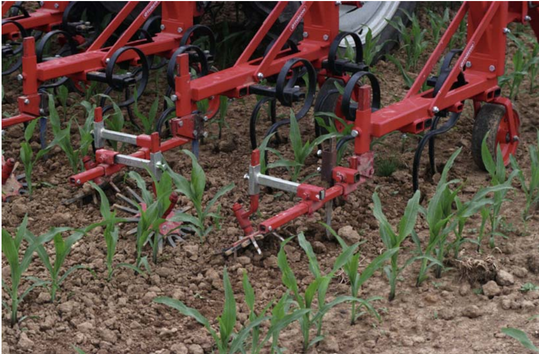
Tritandschoffel plus vingerwieders