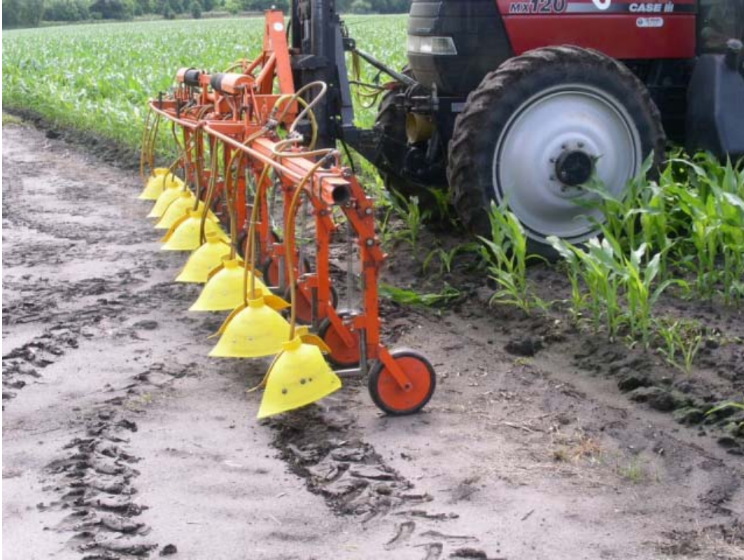
Kappenspuit onderblad bespuitingen