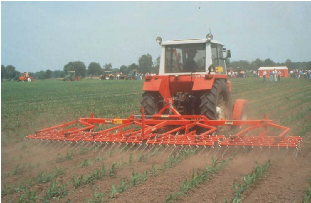
Eggen na opkomst van de maïs