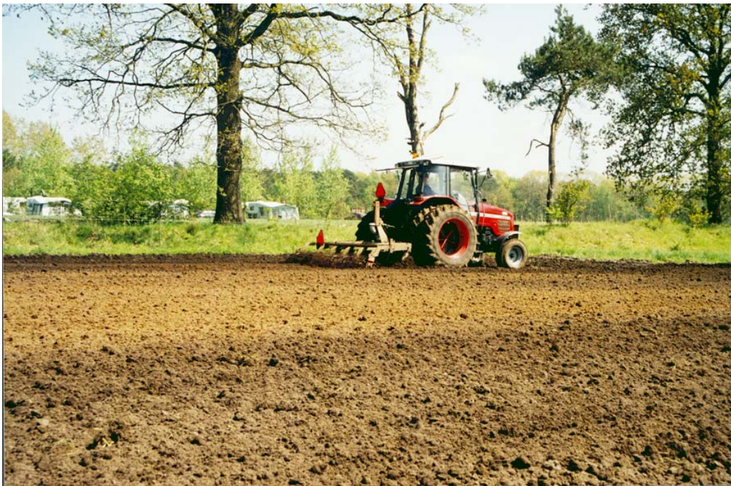
Onkruidbestrijding begint al met de grondbewerking

Op kleigrond ploegt men in de regel in het najaar en maakt men kort voor het zaaien een zaaibed. Dit gebeurt vaak met een aangedreven eg. Hierdoor worden onkruiden die al zijn gekiemd bestreden. Soorten als klein kruiskruid, muur en straatgras kiemen het hele jaar, andere soorten kiemen vooral in het voorjaar, bijvoorbeeld melganzevoet. Hanenpoot en zwarte nachtschade kiemen enkele weken later. Een vals zaaibed, een extra bewerking van de toplaag tot een diepte van circa 2 cm tussen ploegen en zaaien, verstoort de vroeg kiemende soorten. Het zaaien één of enkele weken uitstellen om een extra grondbewerking uit te voeren, wordt in de biologische teelt van maïs toegepast om onkruidbestrijding gemakkelijker te maken. Daarnaast is de beginontwikkeling van de maïs sneller omdat de gemiddeld de temperatuur dan hoger is.