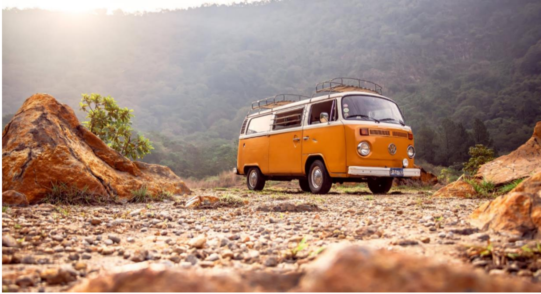
Figure 3: idyllic preview of the traveling soil museum