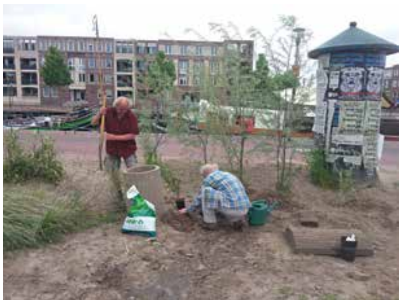
De zandspeelplaats werd herplant.

maakt voor een tijdelijk park. Dat is inmiddels door de werkgroep het Groene Spoor gerealiseerd, inclusief een nieuwe ontsluiting naar de achtergelegen woonwijk.