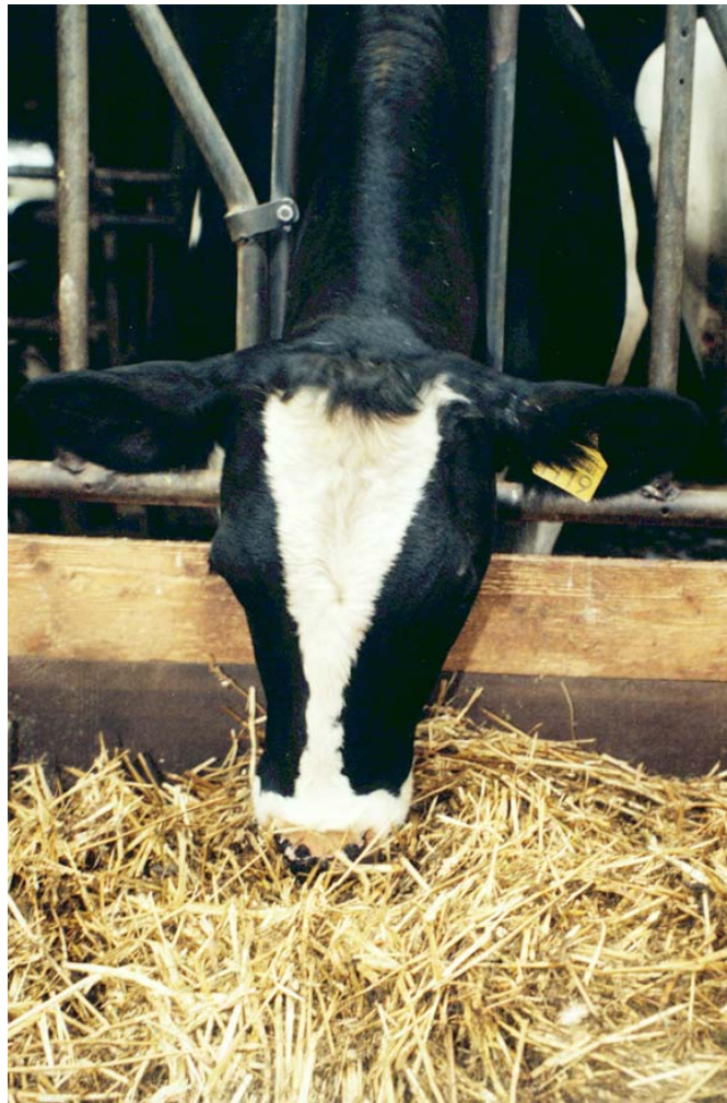
Stro in het rantsoen kan structuurgebrek opheffen