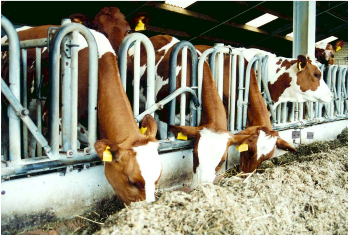
Grotere kans op vervetting bij jongvee met veel snijmaïs

Snijmaïs past ook goed in rantsoenen voor jongvee, maar ook hier bestaat een risico voor vervetting. Bij jongvee jonger dan 1 jaar dat naast ruwvoer nog (eiwitrijk) krachtvoer krijgt, kan men snijmaïs als enig ruwvoer gebruiken. Bij het oudere jongvee moet de hoeveelheid snijmaïs worden beperkt tot maximaal 40% van het ruwvoer.