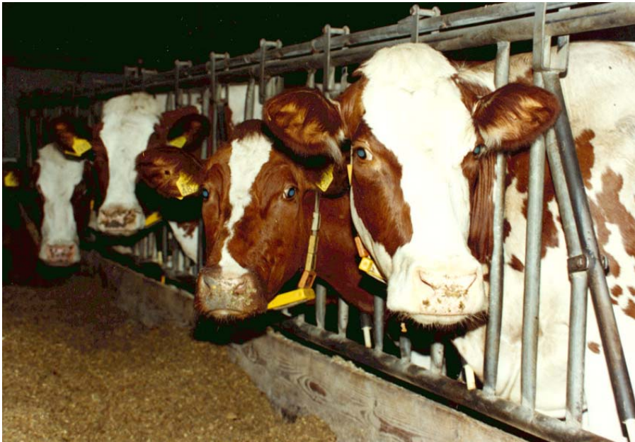
Uitsluitend snijmaïs voor melkkoeien op Cranendonck van 1986-1991

Onder sommige specifieke bedrijfsomstandigheden kan het een optie zijn om uitsluitend snijmaïs als ruwvoer te gebruiken, bijvoorbeeld als er geen of een te kleine huiskavel is of wanneer er geen of te weinig grond beschikbaar is voor ruwvoerproductie. Op praktijkcentrum Cranendonck is een systeemvergelijking uitgevoerd tussen een bedrijfssysteem met gras en snijmaïs en systeem met uitsluitend snijmaïs.