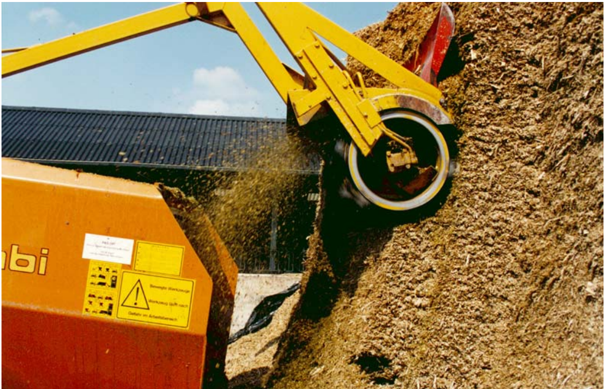
Snijmaïs dankt zijn hoge voederwaarde met name aan het hoge zetmeelgehalte