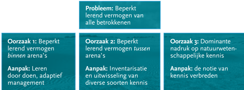
Figuur 2 Het beperkt lerend vermogen verklaard door drie oorzaken