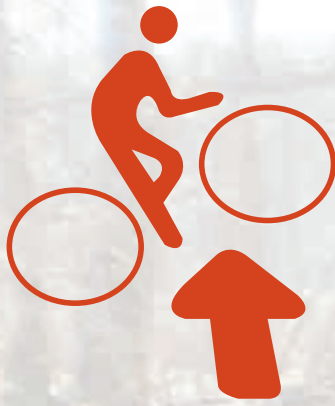
Figuur 2: aaneengesloten netwerk van MBT routes, aanrijroutes en koppelroutes.

alleen nog voor wandelaars noodzakelijk. Veel landgoedeigenaren hebben deze mogelijkheid aangegrepen om mountainbikers van hun terrein te weren. Daardoor zijn deze gedwongen op de vier voor hen uitgezette routes te blijven. De legitimiteit van deze beperking wordt door sommige mountainbikers betwist. Zij rijden buiten de routes, waardoor conflicten met terreineigenaren en andere recreanten niet te vermijden zijn. De terreineigenaren zijn bang voor een verstoring van de natuur (voornamelijk de rust van wild en vogels) en voor aantasting van privacy en eigendomsrecht. De andere recreanten ergeren zich vooral aan onverwacht opduikende mountainbikers waar ze van schrikken en 'van hun sokken gereden worden'. Het aantal mountainbikeritten in dit nationaal park groeit de laatste jaren zeer snel (van iets minder dan 100.000 in 2004 naar 150.000 in 2009). De conflicten tussen terreineigenaren, wandelaars en natuur aan de ene kant en mountainbikers aan de andere kant zullen daarom bij ongewijzigd beleid alleen maar toenemen.