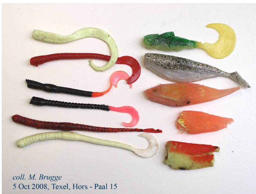
coll. M. Brugge 5 Oct 2008, Texel, Hors - Paal 15

Van Franeker J.A., M. Brugge & A. Gronert 2008. Zeevissen met zacht plastic kunstaas. Sula 21(3): 139-142. For ethical and environmental reasons, a growing number of sea anglers replaces live bait with artificial substitutes. However, beach surveys and seabirds signal increasing environmental problems associated with the loss of 'softbait'. Manufacturers are requested to design softbait that is less prone to be lost, and anglers are asked to be well aware of the potential risk of bait loss.