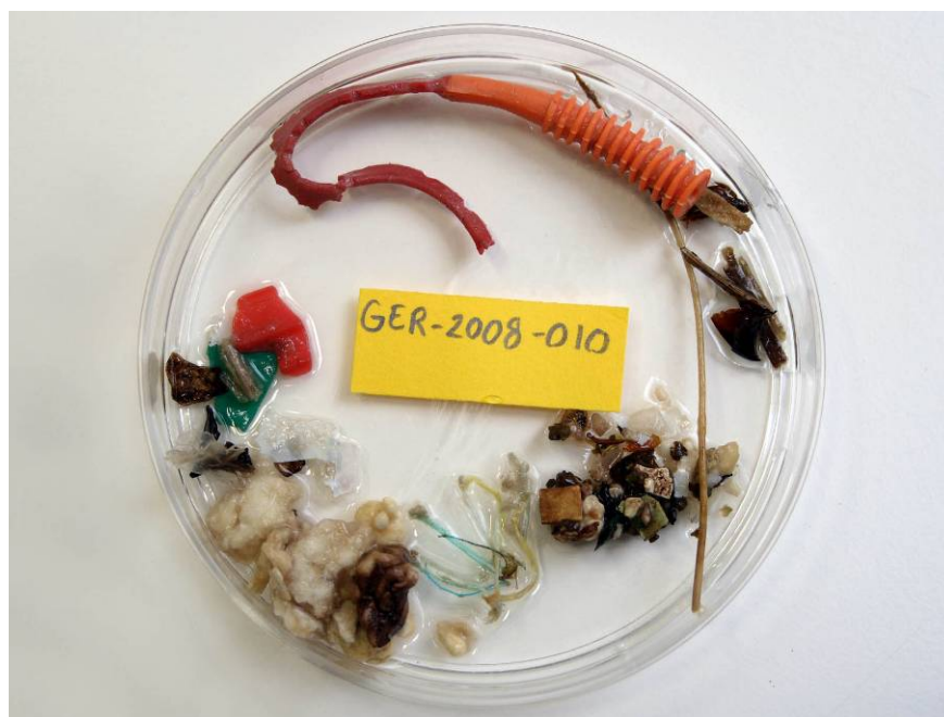
Foto 2. Maaginhoud van een dood gevonden Noordse Stormvogel waarin naast de gebruikelijke kleine stukken plastic ook een softbait zeepier werd aangetroffen – Stomach content of a beached Fulmar which, in addition to the 'normal' fragments of plastic, also contained a softbait lugworm.

Sportvissen met levend aas staat ter discussie vanwege het leed van het aan de haak kronkelende lokaas. Daarnaast oogst het omspitten van de wadbodem voor de veel gebruikte zagers en zeepiers veel kritiek. Het is dan ook begrijpelijk dat de zeehengelsport een overstap maakt naar kunstaas. Gelukkig zijn vissers dom, want ze happen net zo graag in een plastic aasvisje of worm als in hun levende voorbeelden. Creatieve ontwerpers leven hun fantasie helemaal uit en produceren een bizarre rijkdom aan vormen en kleuren van zacht plastic wormen en visjes (Foto 1). Toegevoegde geur- en smaakstoffen kunnen het aas nog extra aantrekkelijk maken en zorgen voor een goede 'beetvastheid' van de vis. Dergelijk high-tech materiaal wordt dan ook niet meer met 'plastic aas' aangeduid, maar staat bekend als 'Softbait' dat voor forse prijzen over de toonbank gaat.