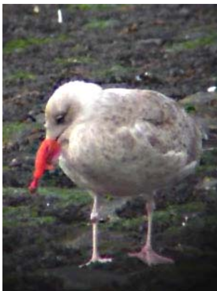
Foto 4. Jonge Zilvermeeuw met softbait haak door de snavel op de Hondsbossche Zeewering - Young Herring Gull with softbait hook through the bill on the Hondsbossche Zeewering.

1 IMARES, Postbus 167, 1790 AD Den Burg (Texel), The Netherlands jan.vanfraneker@wur.nl; 2 NIOZ, Postbus 59, 1790 AB Den Burg (Texel), The Netherlands mbrugge@nioz.nl; 3 Plein 1945 nr 9, 1755 NH Petten, The Netherlands argr@wanadoo.nl