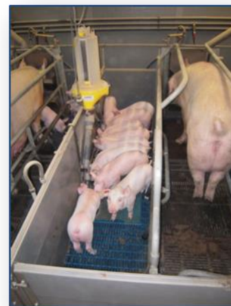
Paar dagen na spenen