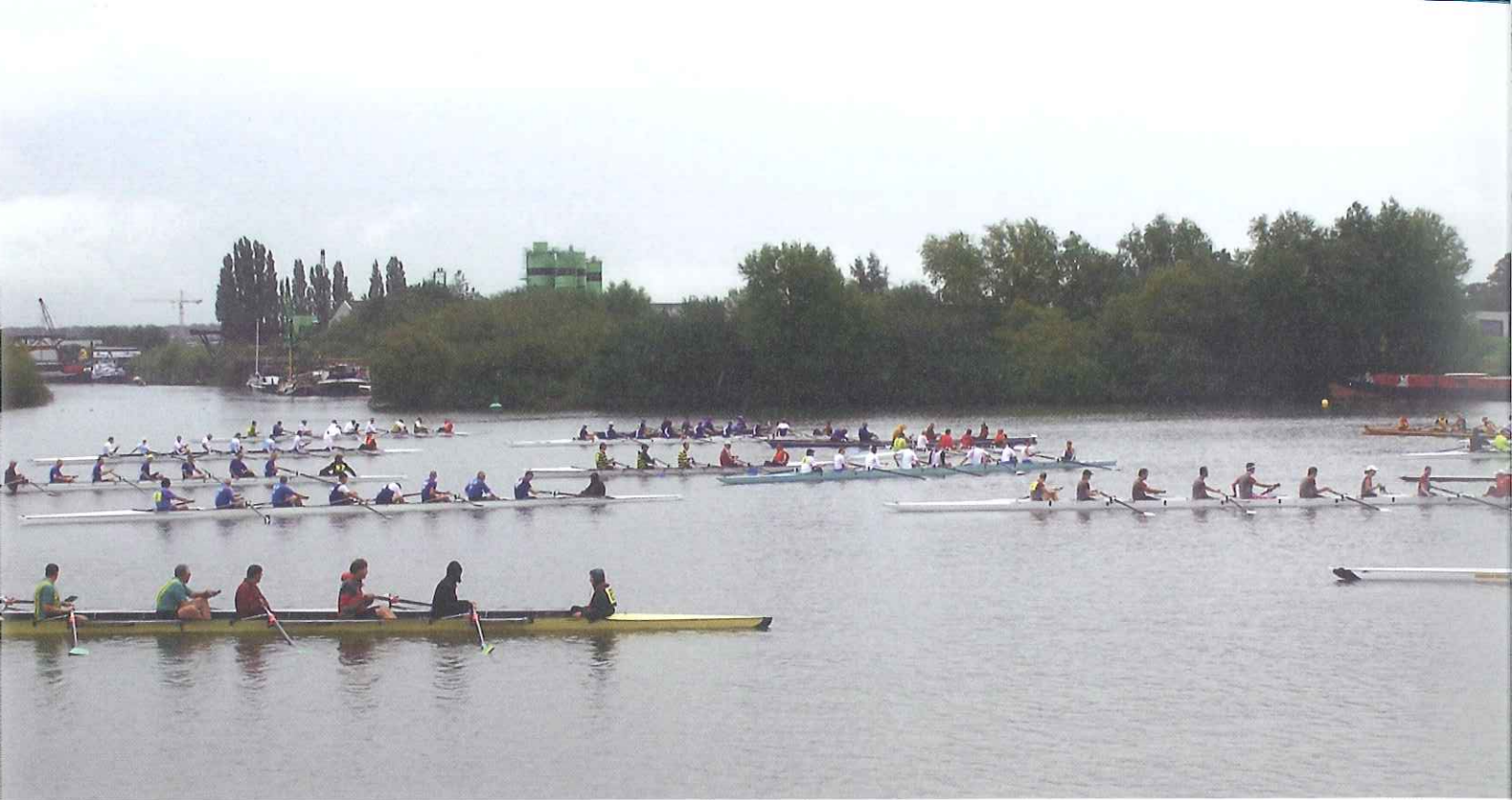
Roeivereniging Isala in haar thuishaven met op de achtergrond industriehaven de Mars.